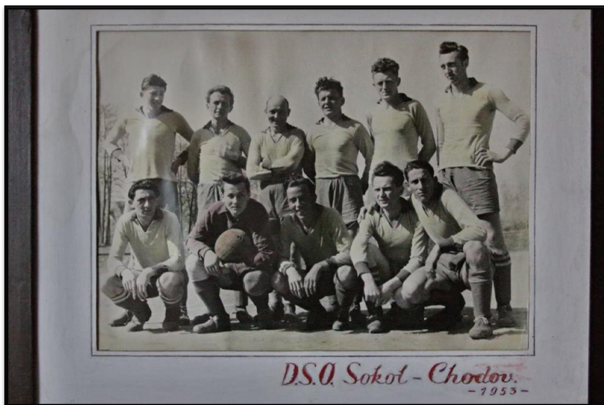
Příloha č. 8. – Mužstvo Chodova (rok neznámý). 153