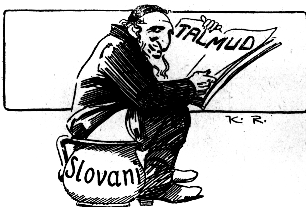
Foto 6 Antisemitská karikatura Karla Rélinka znázorňující v postavě ortodoxního Žida sedícího na nočníku s nápisem Slované údajnou semknutost židovského kolektivu Talmudem, v němž Židé nacházejí návody na zničení slovanských národů. Rélink, K.: Nenažranski, ministr, humanista-filistr, čili, „Kdo do tebe tvrdou palicí ty na něho měkkou (ministerskou) stolicí“: ruská veršová hra, pro loutkové divadlo, o třech jednáních (s prologem). J. S. Schořík: Praha 1927.

Slovanů mělo být odstranění germánsko-židovského nebezpečí. 29 Antisemitský týdeník Staroslovan rozšiřoval informace o tajném židovském ústředí, které údajně připravilo rok 1789, 1848, 1914 i 1917. 30 Žádný z antisemitských subjektů pak nepochyboval o tom, že Židé ovládli Československo, Svaz národů 31 i řadu dalších organizací. Mezi radikálními antisemity sílilo přesvědčení, že rozhodující zápas se Židy svede Německo, 32 jehož ostrá nenávisť proti Židům byla v českém antisemitském prostředí přijímána vysoce pozitivně.