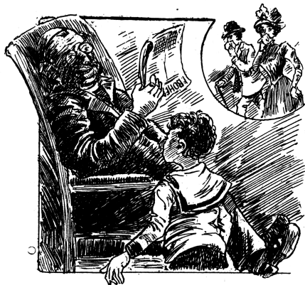
Křesťané si drží jen noseček. Našinci drží celý svět.

Foto 3 Národněsociální karikatura spojující antisemitskou představu Židů jako vládců světa a antijudaistickou primitivní představu smradlavého Žida. Postava Žida je vykreslena jako ortodoxně a proněmecky smýšlející. Hrom III/1901, č. 4, 24. 3., str.: 7.