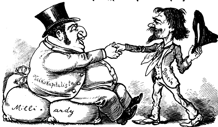
Foto 4 Antisemitská konspirační teorie z devadesátých let 19. století znázorňující spojení židovských boháčů (cylinder na hlavě postavy Žida označuje jeho německví) a sociálních demokratů (socialista je označen kloboukem se širokou krepkou a červenou vázankou) v mladočeské karikatuře. Humoristické listy 41/1899, č. 25, 23. 6., str.: 4.