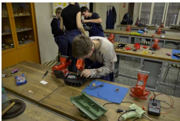
Obr. 1 Práce v kroužcích „Elektronika hrou“ a „Postav si robota“

Rodiče i děti uvedený způsob výuky i kroužky jako takové velmi chválili. I my učitelé jsme pozitivně hodnotili práci v kroužcích, chování dětí i jejich přístup k práci. Postupně jsme