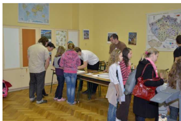
Obr. 2 Robotický den na základní škole

Díky robotům, se mohou naučit vývoji, konstrukci a programování systémů, pracujících v reálném čase, psaní driverů pro počítačové komponenty, filozofii diagnostiky, analýzy, řízení, algoritmizace chování systémů kolem nás. Tato výuka se může a musí zaměřovat na různé aplikační sféry podle zájmu žáků a potřeb trhu práce.