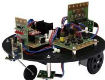
Obr. 1: Stavebnice H&S electronic systems BASIC ( http://www.hses.cz )

Po shrnutí vlastností stavebnic a našich požadavků jsme dospěli k vyhodnocení, že nejvhodnější robotickou stavebnicí sloužící k výuce technických předmětů na základních školách je H&S electronic systems (viz Obrázek 1).