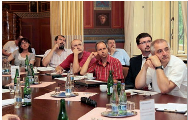
Účastníci setkání Workshop SCIAP 2012