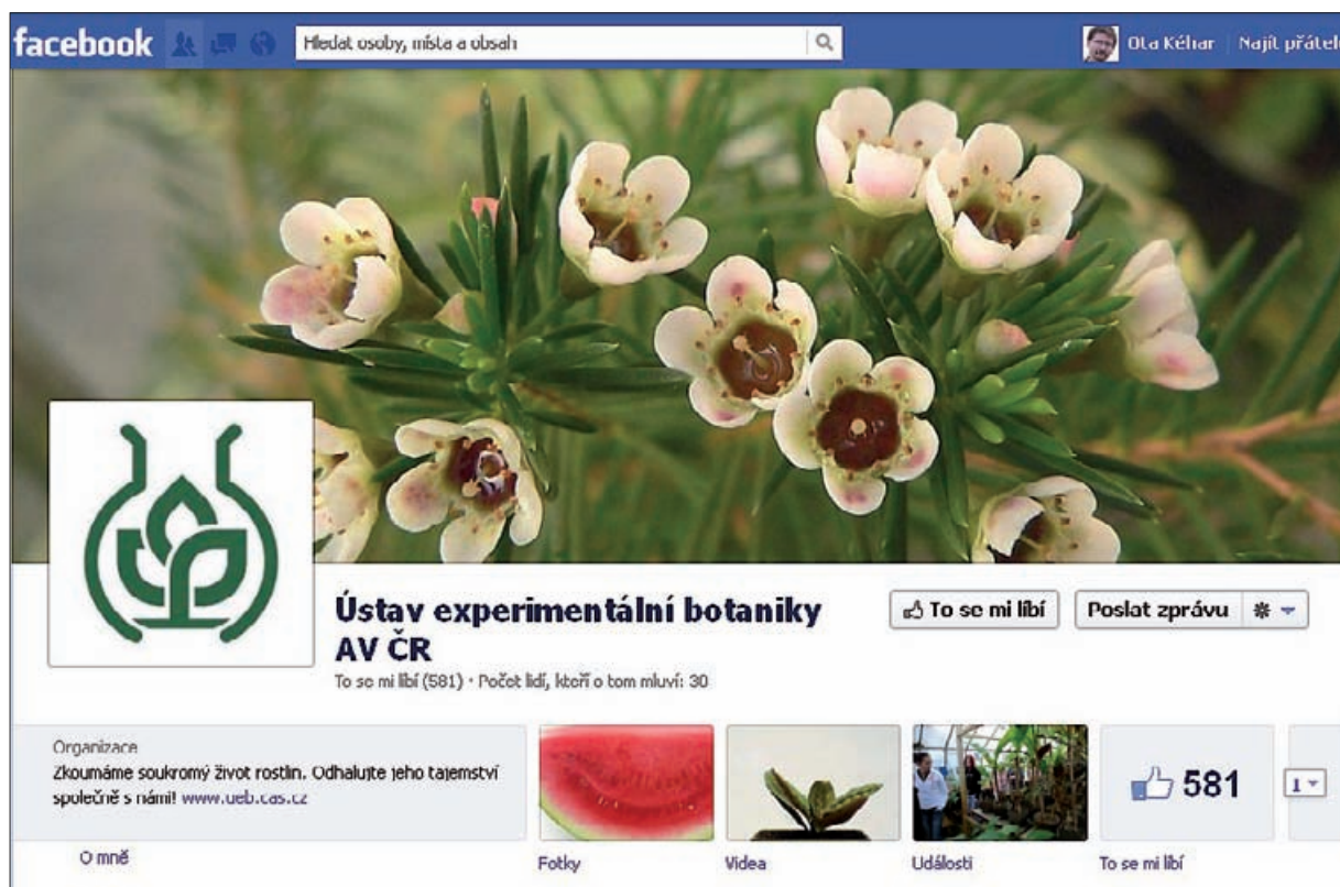
Facebooková stránka Ústavu experimentální botaniky AV ČR