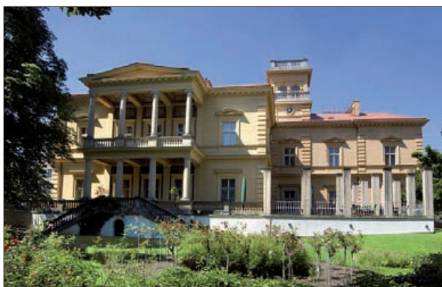
Vila Lanna

Popularizace vědy je hojně používaný termín. Zahrnuje veškeré aktivity, které ukazují vědu jako nástroj rozvoje lidstva každému člověku, bez rozdílu věku, vzdělání, národnosti a sociální příslušnosti. Cílem popularizace vědy je poskytnout informaci široké veřejnosti, vzbudit u společnosti zájem o vědecké obory a získat potřebné finance a potenciální vědce. Již vloni na podzim uspořádala SSČ AV ČR první soutěžní přehlídku popularizace vědy SCIAP 2011. Samotná zkratka SCIAP je utvořena ze slov „SCIENCE APPROACH“, volně lze přeložit jako „Přiblížení vědy“, což plně koresponduje s mottem soutěže: „Svět vědy je světem poznávání a soustavného rozšiřování bohatství kultury lidstva. Cílem popularizace vědy je tento poklad vědění představovat veřejnosti.“