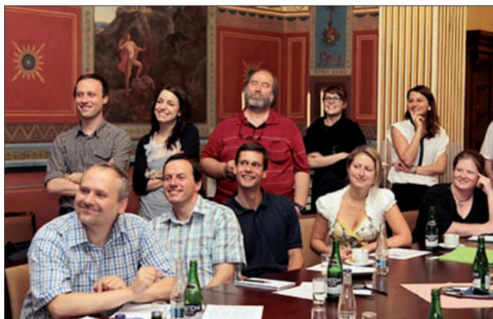
Někteří účastníci setkání při sledování poutavé ukázky divadla ÚdiF