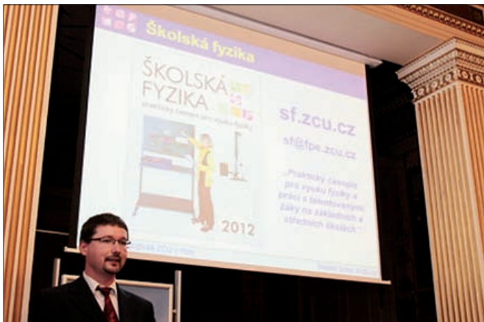
Propagace Školské fyziky na setkání Workshop SCIAF 2012

Školské fyzice bylo vyhrazeno zhruba 10minutové povídání doplněné o obrazový materiál, který obsahoval informace o zaniknutí časopisu na začátku tisíciletí z důvodu zaneprázdnění týmu. Stručně byla zmíněna cesta k znovuoživení časopisu v roce 2012, kdy vznikla elektronická podoba časopisu. Následoval popis webových stránek (vztahu aktuálního čísla, článku, archivu čísel), registrace, přihlášení a výhody z toho plynoucí – možnost komentovat a hodnotit jednotlivé články. Připomenuto bylo fulltextové vyhledávání v textech článků, verze pro mobilní telefony a pár statistických čísel na závěr v podobě počtu registrovaných čtenářů, počtu čísel a návštěv, případně orientační termíny vydání čísel v roce 2012. Představena byla redakční rada, realizační tým a autoři jednotlivých článků. Podotkl jsem, že hledáme autory se zajímavými tématy, abyste vy čtenáři měli co číst, komentovat a hodnotit.