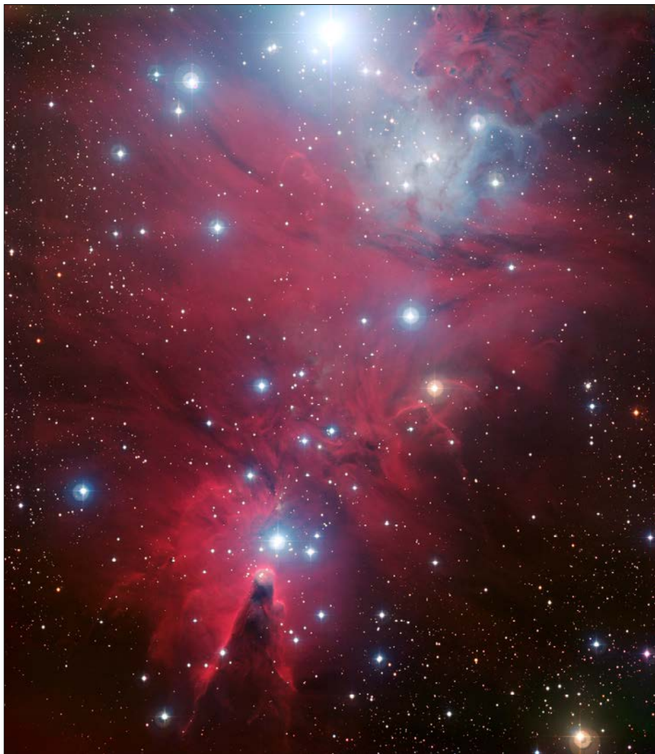
Obr. 1 – snímek NGC 2264 pořízený na Evropské jižní observatoři pomocí dalekohledu s průměrem objektivu 2,2 metry; http://www.eso.org/public/outreach/press-rel/pr-2008/phot-48-08.html

NGC 2264 je od Země vzdálena okolo 2 600 světelných let. V astronomickém měřítku je to velice blízko, nicméně naše představivost se s takovou vzdáleností dokáže vypořádat jen velice obtížně. Samozřejmě pouze pokud vynaložíme to úsilí a pokusíme si 2 600 světelných let představit. Ono totiž i na naši nejbližší hvězdu – Slunce, vzdálenou 8 světelných minut, bychom na kole cestovali celých 20 lidských životů. A to pouze za před-