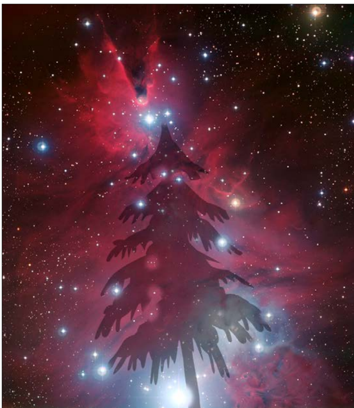
Obr. 2 – rozložení hvězd rozhodlo o pojmenování této hvězdokupy

Nejenom na zobrazené části rozsáhlého oblaku molekulárního plynu, ale v celém jeho objemu neustále dochází ke vzniku nových generací hvězd. Mezi nejaktivnější oblasti patří okolí hvězdy S Mon a okolí další jasné hvězdy na vrcholu Kužele. Přestože jsou hvězdné jesličky na snímku obtížně pozorovatelné, vychází z těchto oblastí silný hvězdný vítr, jehož vliv na okolní hmotu je dobře patrný. Fotony a také plyn vyvrhovaný z rodících se hvězd doslova tlačí na okolní prachoplynná oblaka a (de)formuje jejich podobu. Podobný jev známe i u našeho Slunce. Ohon komet je slunečním větrem stáčen vždy ve směru od Slunce v důsledku