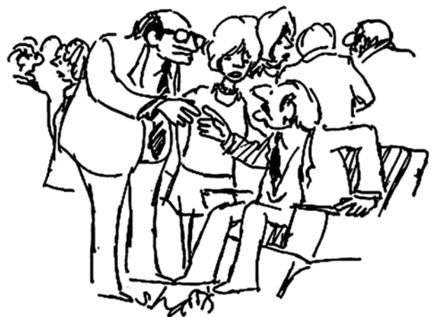
„Oba máte něco společného. Dr. Davis objevil částici, kterou nikdo neviděl, a prof. Higbe objevil galaxii, kterou nikdo neviděl.“