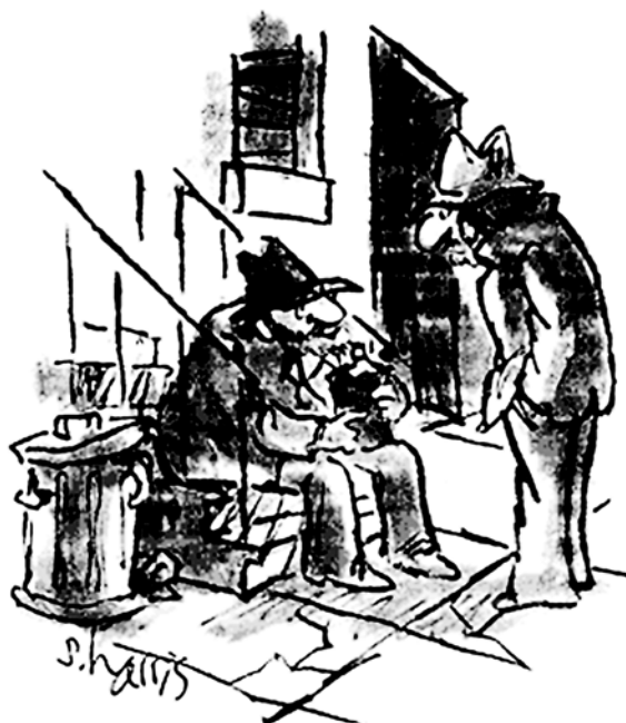
„Kvarky. Neutrino. Mezony. Všechny tyhle zatracené částice nejsou vidět. Proto já piju. Teď už je vidím!“