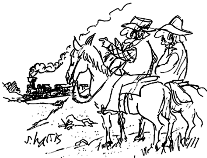
„Rád poslouchám osamělé kvílení vlakové píšťaly, jehož frekvence se mění v důsledku Dopplerova jevu“