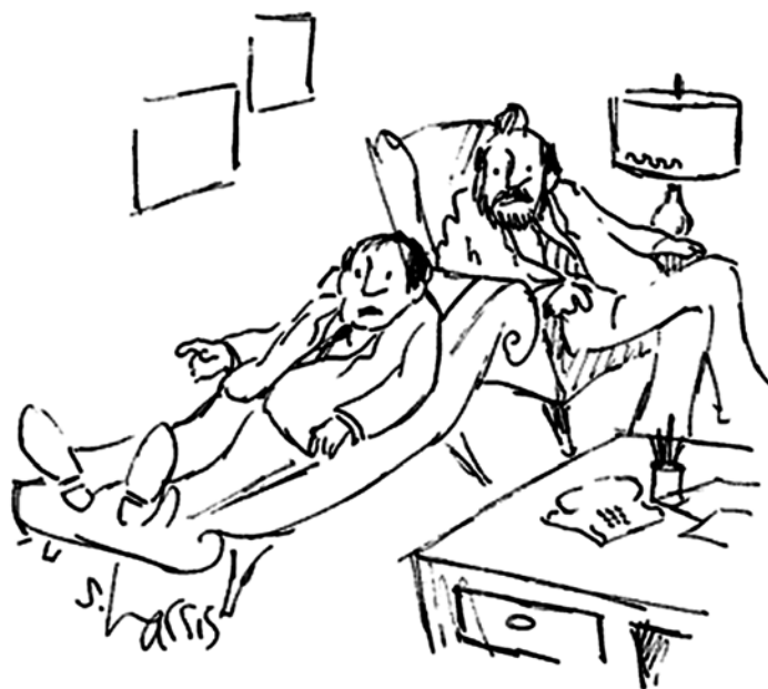
„Jsem fyzik. Pracuji v laboratoři. Zamiloval jsem se do jedné fyzičky ze stejné laboratoře. Ukázalo se, že jde o hologram.“