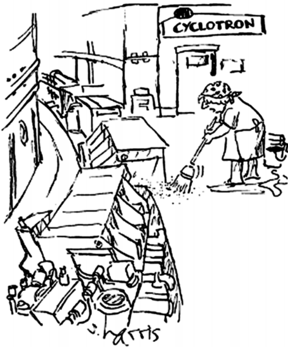
„Částice, částice, samé částice.“

Z internetových zdrojů vybral Václav Kohout 1