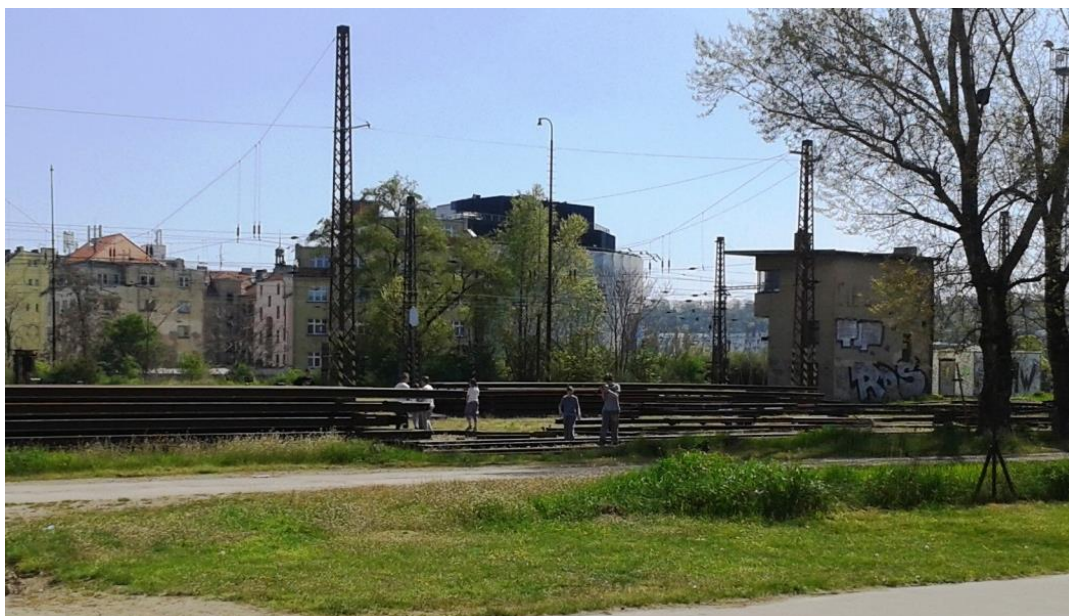
Obr. 6 – Venčenie psov v blízkosti funkčnej vlakovej stanice Praha – Bubny. Pohľad z juhu na sever.