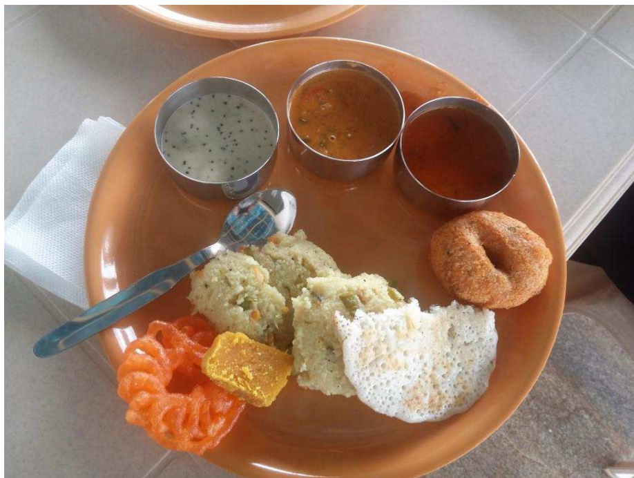
Obrázek č. 3: První „konferenční“ oběd v prostorách Srishti School.