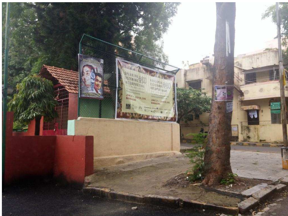
Obrázek č. 1: Plakát ke konferenci.