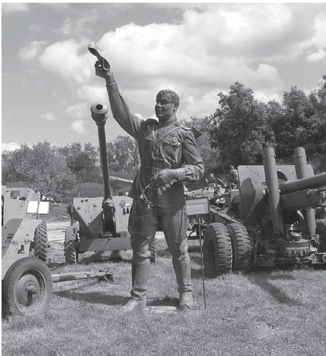
Picture 2: The statue of the Red Army soldier in the Museum on the Demarcation Line in Rokycany.