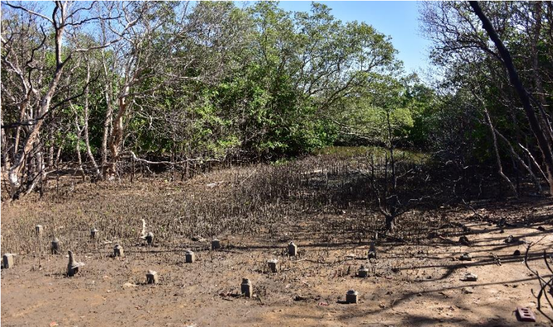
Příloha č. 1. Dunn's Pool v Mtunzini.