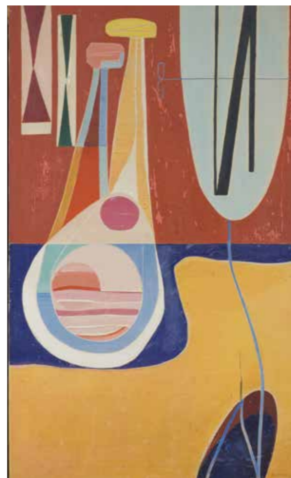
Ladislav Sutnar, Saltwater Plant, pol. 50. let min. stol.

and Drake Furniture, Vera Neumann Company nebo Addo-x. Své poznatky publikuje v knihách o obalovém designu a aranžování zboží. V šedesátých letech Sutnar shrnuje své profesní krédo prostřednictvím putovní výstavy a knihy Visual Design in Action. Inovuje vizuální styl amerického telefonního seznamu a poprvé vystavuje malby aktů, které označí jako Venus: Joy-Art. V sedmdesátých letech se vrací do vlasti prostřednictvím korespondence s pracovníky Uměleckoprůmyslového musea v Praze. Je to čas rekapitulace a reflexe. Život Ladislava Sutnara se završuje v New Yorku v roce 1976. V roce 2014 jsou díky projektu Návrat Ladislava Sutnara v Plzni uloženy ostatky Sutnara a jeho manželky.