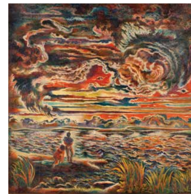
Vladimír V. Modrý, Jezero.

postřelen při účasti na ozbrojeném povstání. Po roce 1948 vystupuje z komunistické strany zhnusen nízkými poměry v regionálních orgánech. Osobnostně nevyhovuje dobovým nárokům, odmítá přehnanou angažovanost, kariérismus a laciné podbízení. Jeho práce také nesplňuje parametry programově požadované po umělecké tvorbě. Všechny tyto okolnosti, včetně podlomeného zdraví, vedou Modrého k odchodu do ústraní. Modrého styl je vysoce ceněn pro spirituální duchovnost a barevnou a světelnou stylizaci, tolik se lišící od požadavků nastolovaných socialistickým realismem. Celospektrální barevnost obrazů podporovaná nezvyklou nadpřirozenou světelností a dynamikou tvarové kompozice přiřazuje Modrého práce k tradici středověké mystiky a ke spiritualitě pozdějšího symbolismu. Tendence k znovuuvedení Modrého na plzeňskou regionální scénu probíhají po uvolnění společenské situace koncem šedesátých let. V roce 1976 se však na jeho zdravotním stavu naplno projeví všechna předchozí strádání. Malíři jsou jako důsledek silné diabetes amputovány obě nohy a Vladimír V. Modrý v roce 1976 umírá.