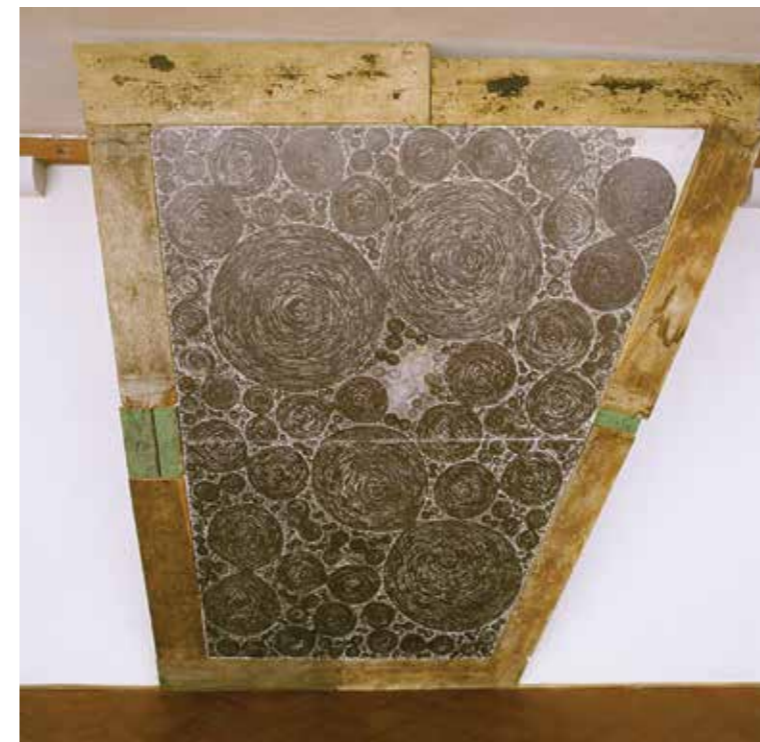
Vladimír Merta, obraz-objekt Reklama na nekonečno, 1989.