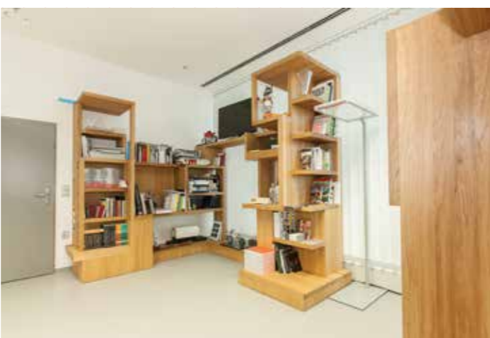
Luděk Míšek, knihovna v pracovně děkana FDULS.