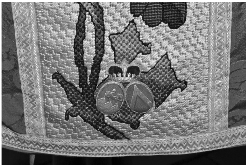
Obr. 6 – Detail erbů hrabat Ervina a Kristiny Schönbornových, foto Radka Süssová.