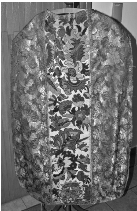
Obr. 3 – Zadní strana ornátu s erbem Marie Josefy z Lobkovic, foto Radka Süssová.