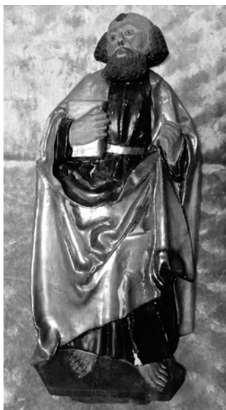
Obr. 8 – Mistr týneckého Zvěstování, reliéf sv. Petra, kolem 1520, foto Michal Tejček.