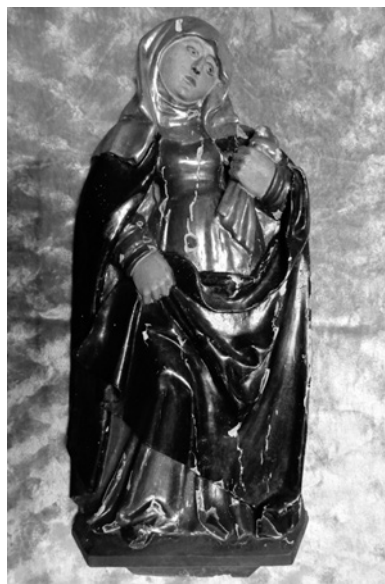
Obr. 9 – Mistr týneckého Zvěstování, reliéf sv. Ludmily, kolem 1520.