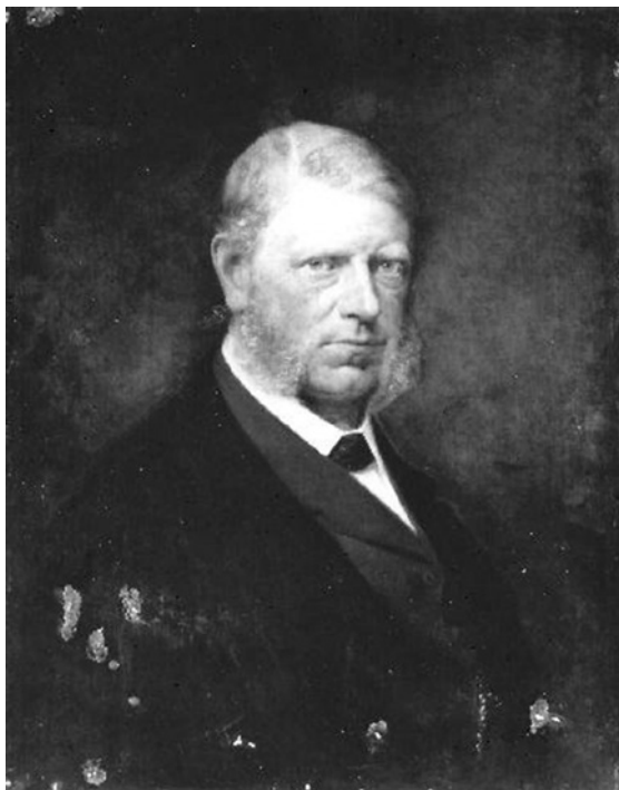
Obr. 7 – Portrét hraběte Ervina Schönborna (1812–1881) od Františka Ženíška, převzato z: Wikipedie.