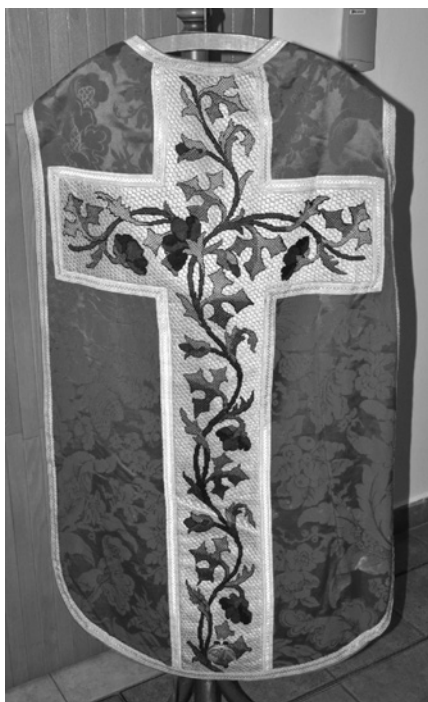
Obr. 5 – Zadní strana ornátu s erby Ervina Schönborna a jeho manželky Kristiny.