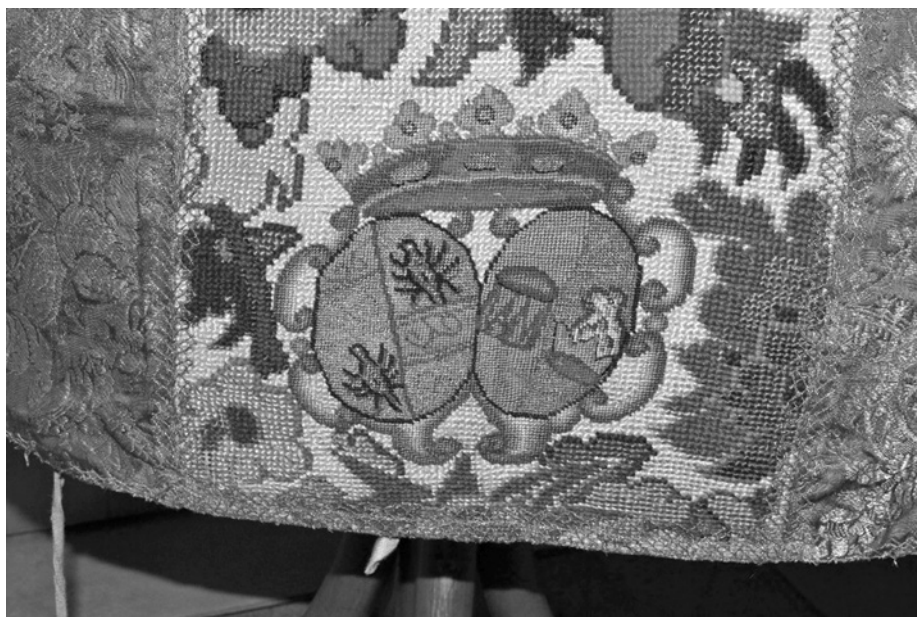
Obr. 4 – Detail erbu Marie Josefy z Lobkovic, foto Radka Süssová.