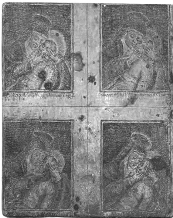
Obr. 1 – Nalezený štoček čtyř drobných obrázků Panny Marie Přeštické, foto DHP.