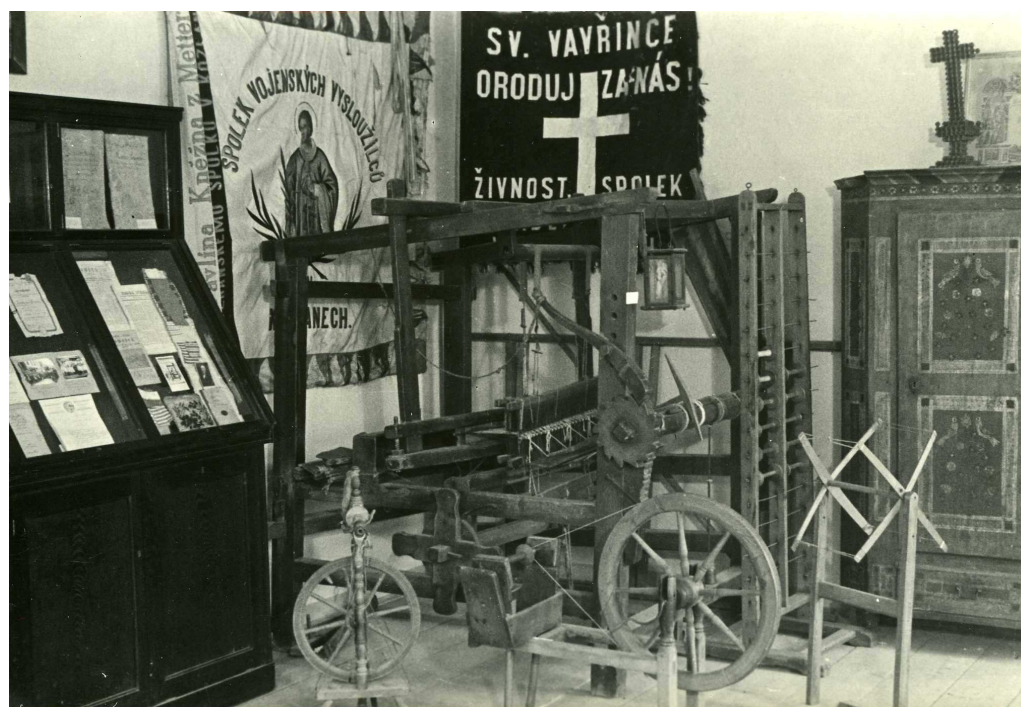
Kožlany, muzejní expozice v roce 1947.