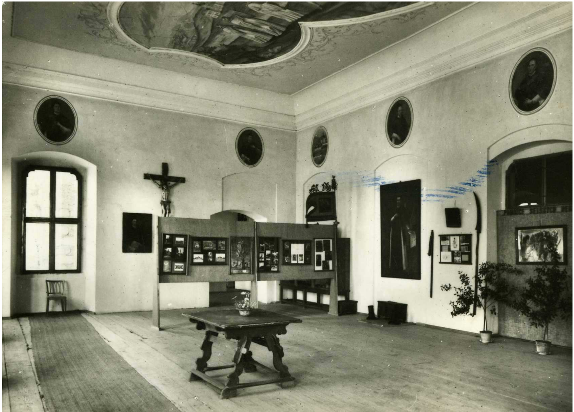
Mariánská Týnice, muzejní expozice na pohlednici kolem roku 1970.