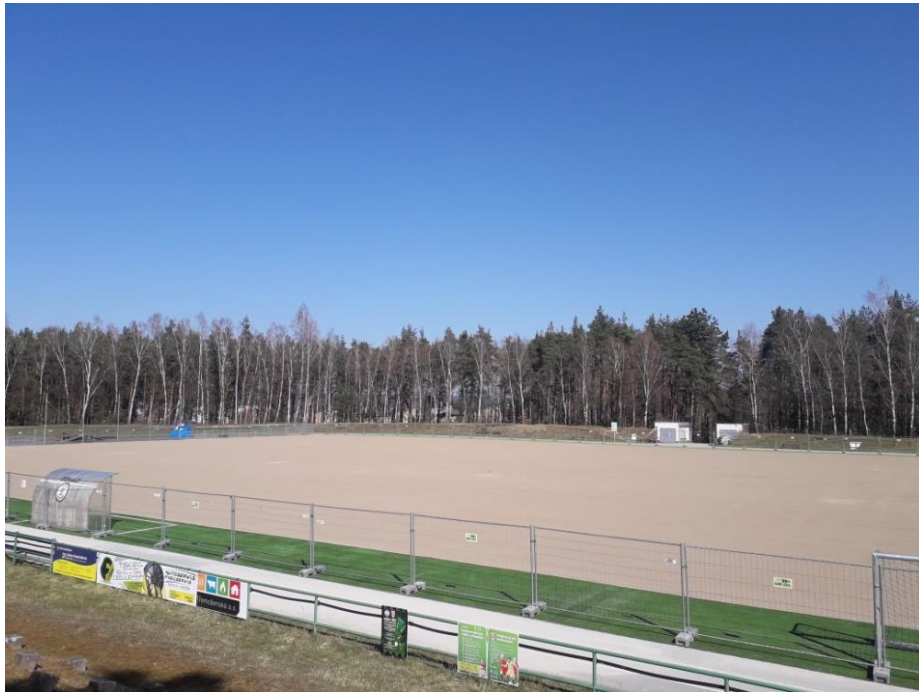
Obrázek 6: Fotbalové hřiště při rekonstrukci, Třemošná 67