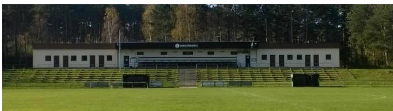
Obrázek 3: obě nové budovy šaten a tribuna, Třemošná 63