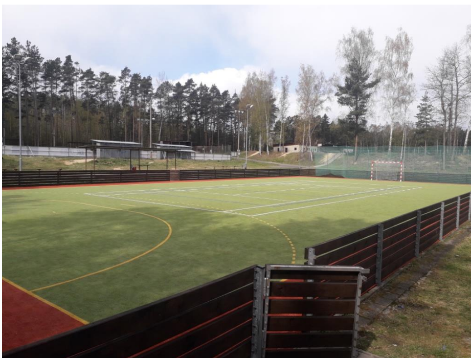
Obrázek 5: nový umělý povrch házenkářského hřiště, Třemošná 66