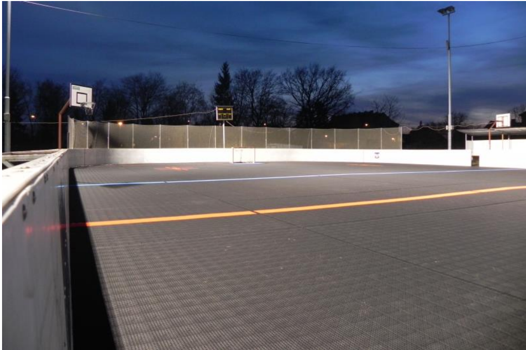
Obrázek 8: staré hokejbalové hřiště s plastovým povrchem, Dobřany 69