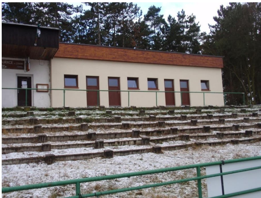
Obrázek 2: nová budova severní části šaten, Třemošná 62