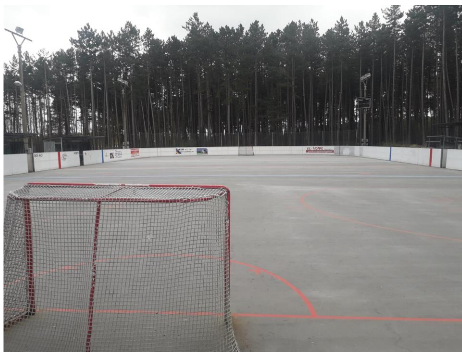
Obrázek 4: nový akrylátový povrch hokejbalového hřiště, Třemošná 65

Inovace v případě tenisových kurtů proběhla tak, že oba kurty byly otočeny o 90°. Důvodem bylo nevyhovující původní natočení s ohledem na světové strany.