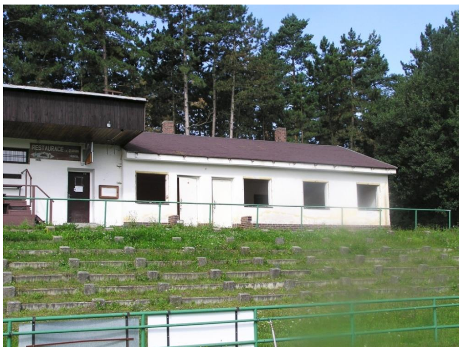
Obrázek 1: budova severní části šaten před zbouráním, Třemošná 61