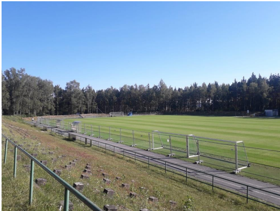
Obrázek 7: Fotbalové hřiště po rekonstrukci, Třemošná 67