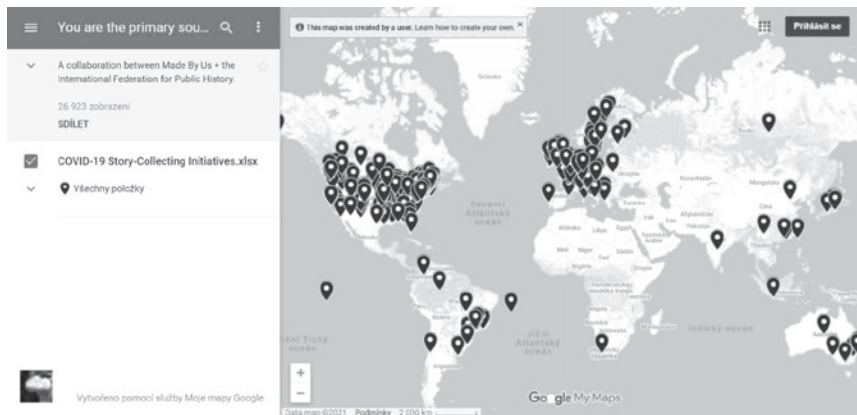
Obrázek č. 2: American Historical Association, Collecting Initiatives, What’s Your Story 47