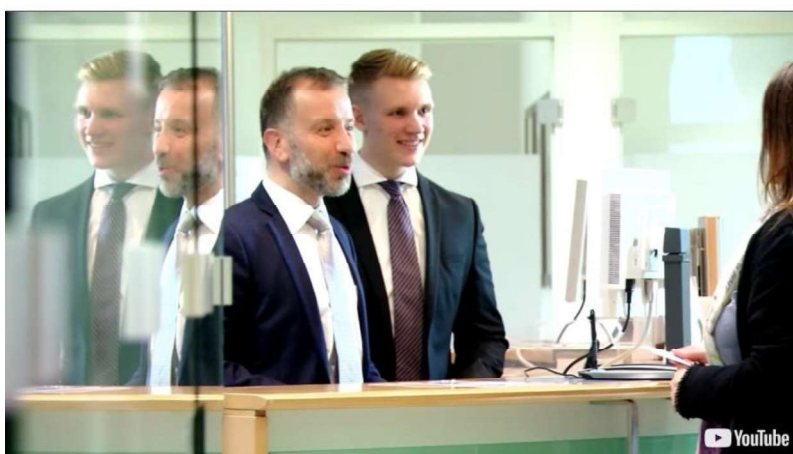
Fig. 3: Příklad 2 EdPuzzle