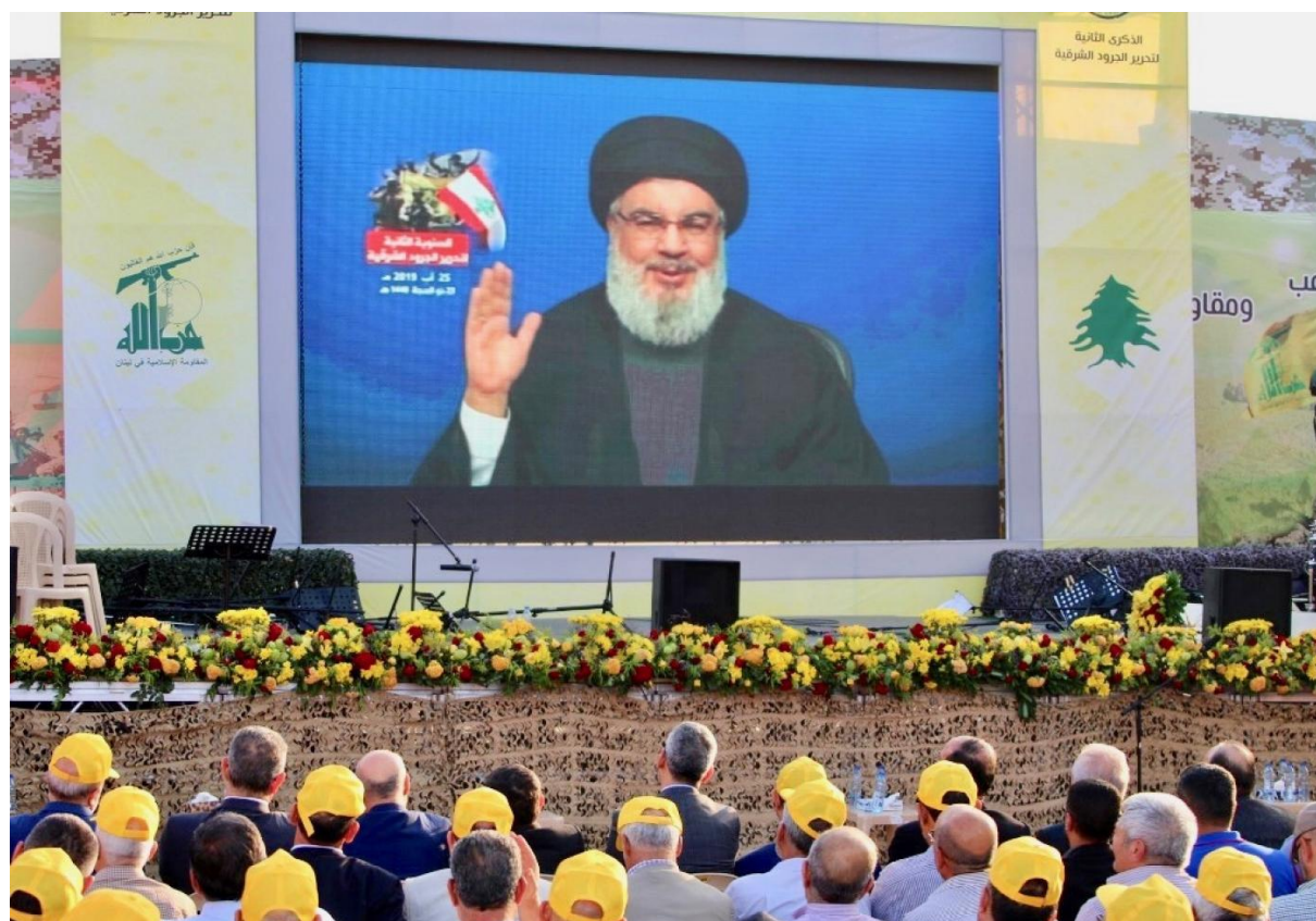
Hasan Nasrallah. 285