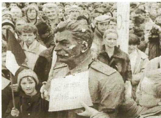
NICHTS WÄHRT EWIG steht auf dem Schild, das Demonstranten in Prag einem Stalin-Denkmal umgehängt haben.

Lebenswichtige Betriebe wie Krankenhäuser und Verkehrsunternehmen schlossen sich dem Ausstand symbolisch für etwa zwei Minuten an. Rundfunk und Fernsehen „streikten“ auf ihre Art mit