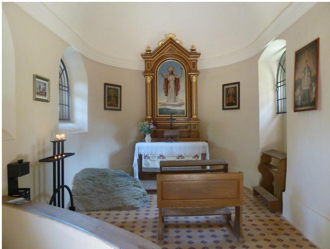
Příloha č. 14: Interiér Šlápějové kaple s oltářním obrazem sv. Wolfganga 146