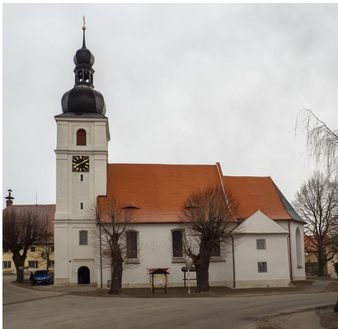
Příloha č. 3: Farní kostel sv. Jana Křtitele, gotická třídílná archa 135