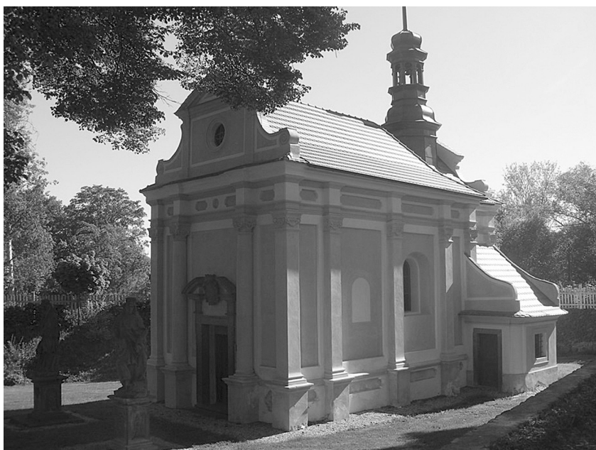
Einsiedelnská kaple v Radíči. Foto: Jan Kilián, 2013.