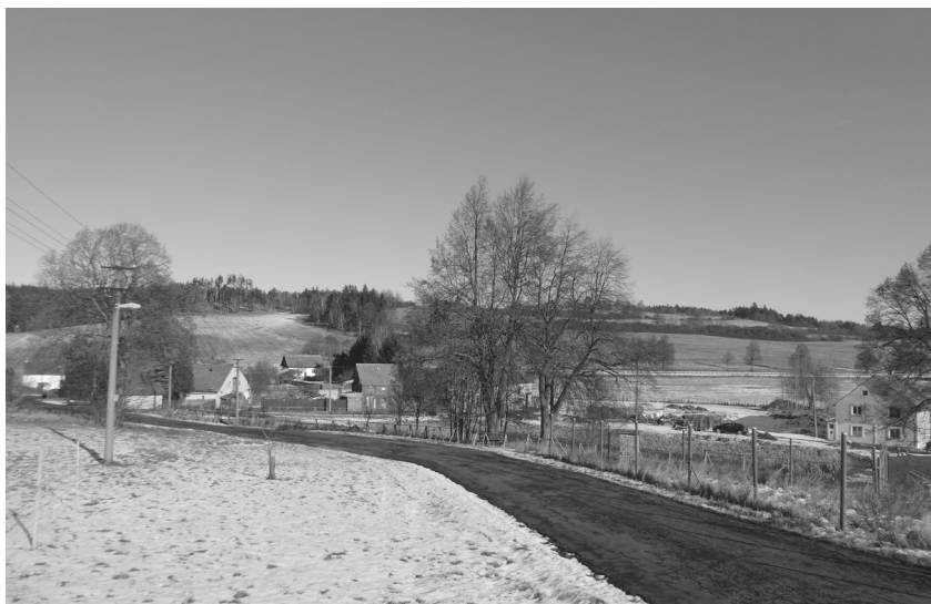
Intravilán obce Smilov. Foto: Michal Vokurka, 2022.