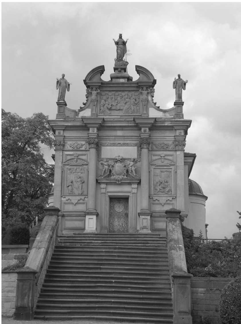
Einsiedelnská kaple v Rastattu. Foto: Michal Vokurka, 2017.