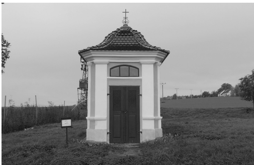
Einsiedelnská kaple v Ploskovicích.