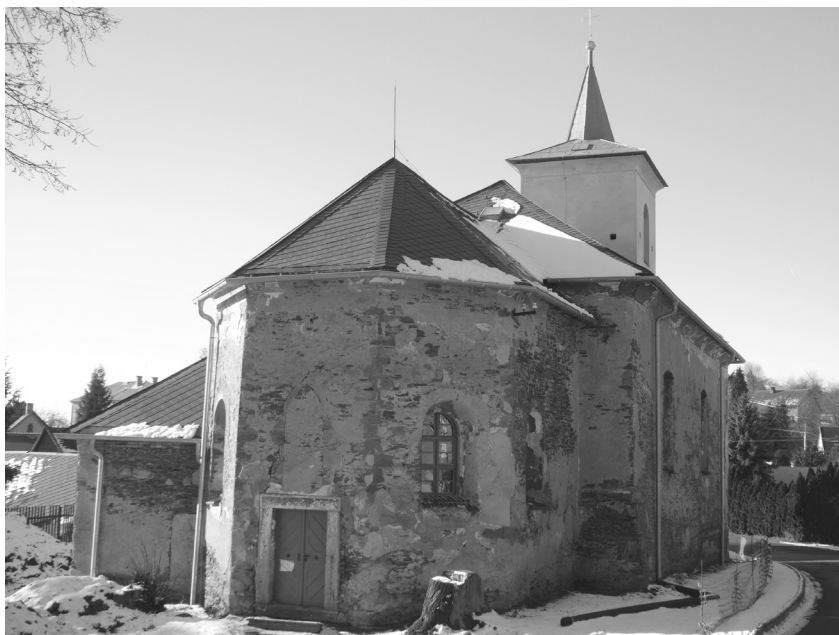
Závěr farního kostela sv. Michaela Archanděla v Brložci. Foto: Michal Vokurka, 2022.