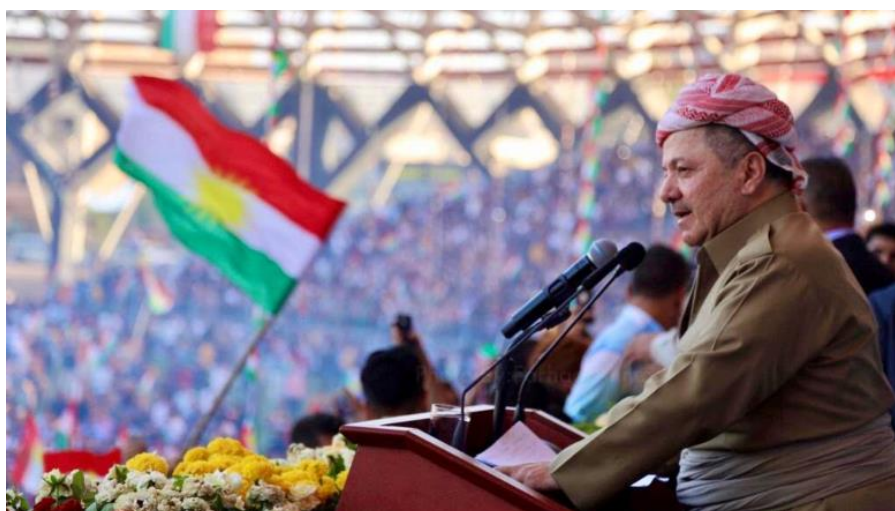
7. Bývalý prezident Masúd Barzání.