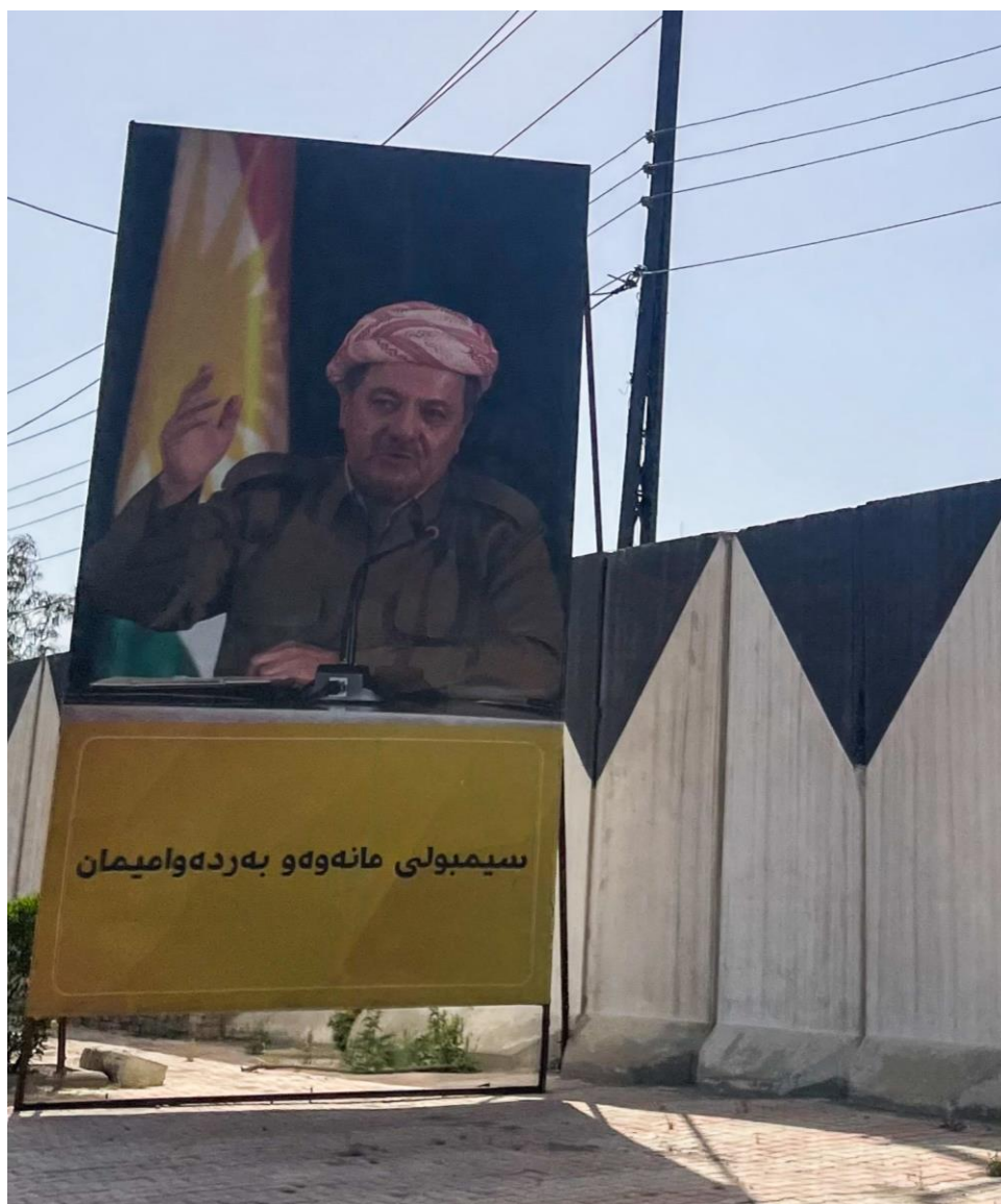
3. Plakát s Masúdem Barzáním v Erbílu.