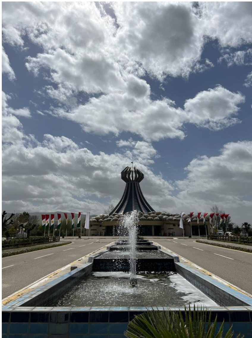
1. Památník obětí během operace an-Anfál v Halabži v provincii Sulajmánija.