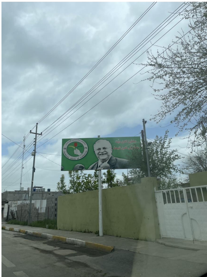
2. Plakát s Džalalem Talabáním v provincii Sulajmánija