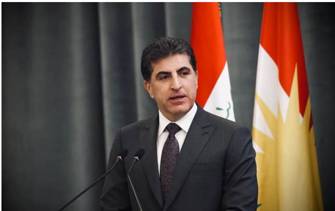
6. Prezident iráckého Kurdistanu Nečirvan Barzání.