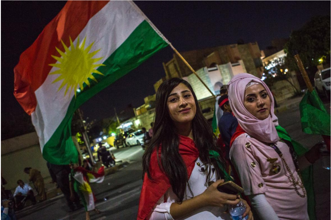
5. Oslavy krátce před referendem o nezávislosti v Erbilu.