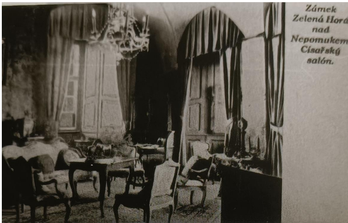
Obr. č. 1 - Zámek Zelená Hora – císařský salón r. 1935. ULRYSCHOVÁ, M., MOUČEK, R. "Osmičkové" roky na Nepomucku. s. 92.