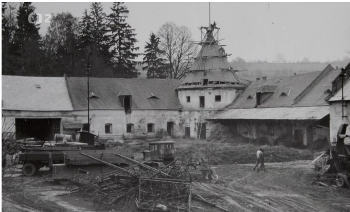
Obr. č. 6 – Zámek Manětín – přílehlé hospodářské prostory po roce 1948. ČESKÁ TELEVIZE. iVysílání. Skryté skvosty – Manětín . [on line].