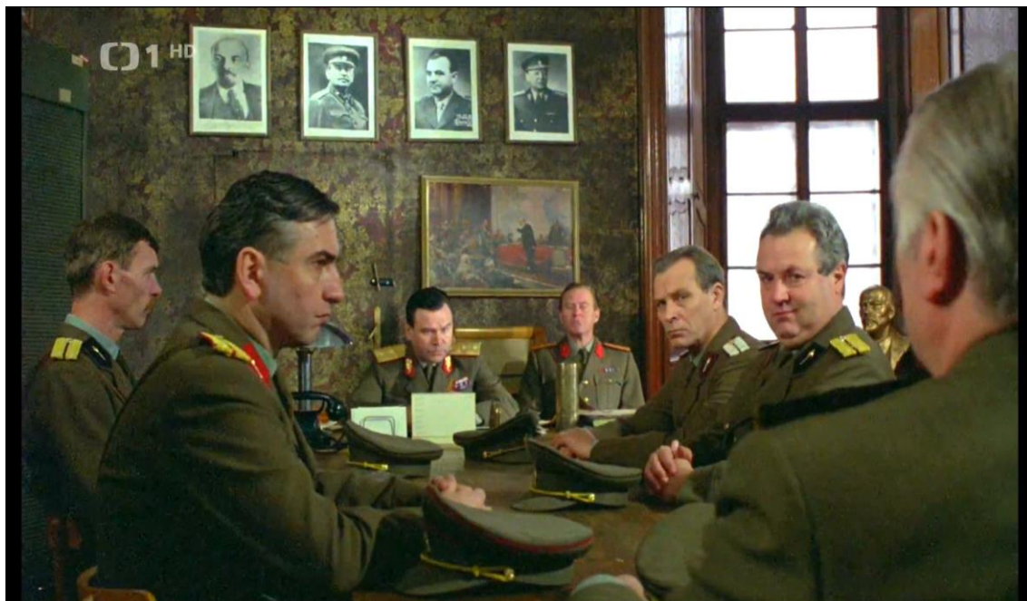
Obr. č. 3 – Zámek Zelená Hora – císařský salón jako kancelář velitele vojenského útvaru ve filmu Černí baroni. Černí baroni . [film]. Režie: Zdeněk Sirový. 1992.