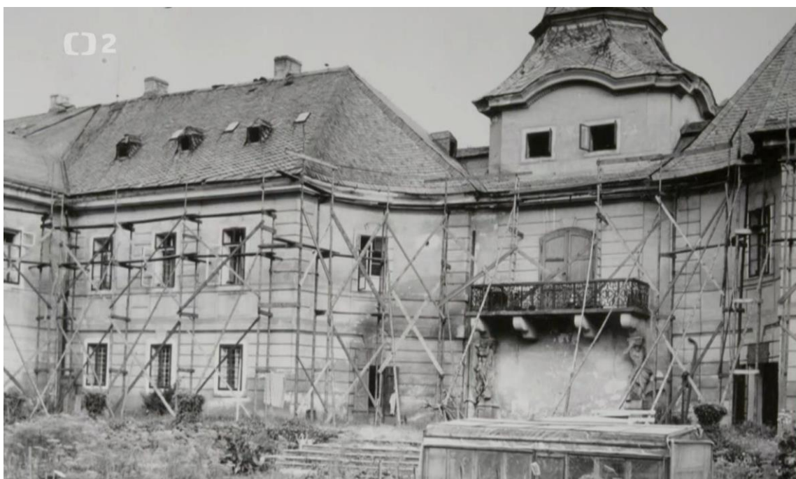
Obr. č. 5 – Zámek Manětín – hlavní budova zámku po roce 1948. ČESKÁ TELEVIZE. iVysílání. Skryté skvosty – Manětín . [on line].