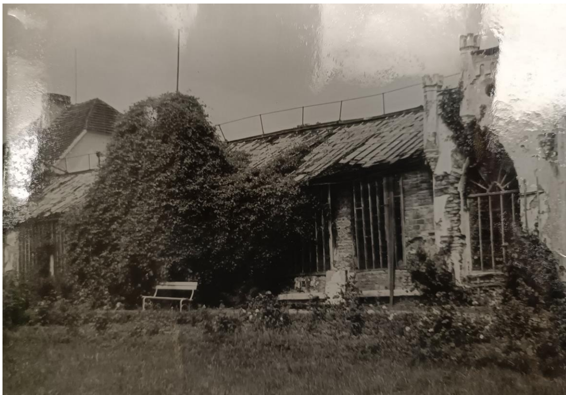
Obr. č. 8 – Zámek Hradiště – empírový skleník v dezolátním stavu před demolicí v roce 1950.