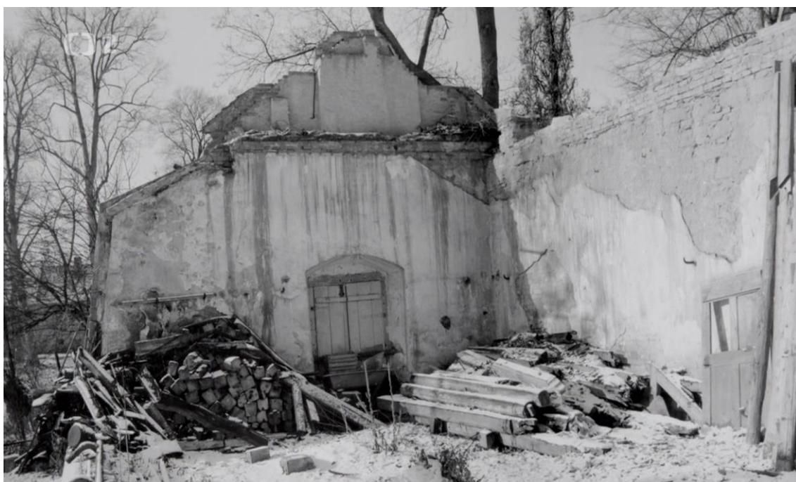
Obr. č. 7 – Zámek Manětín – přílehlé hospodářské prostory po roce 1948. ČESKÁ TELEVIZE. iVysílání. Skryté skvosty – Manětín . [on line].