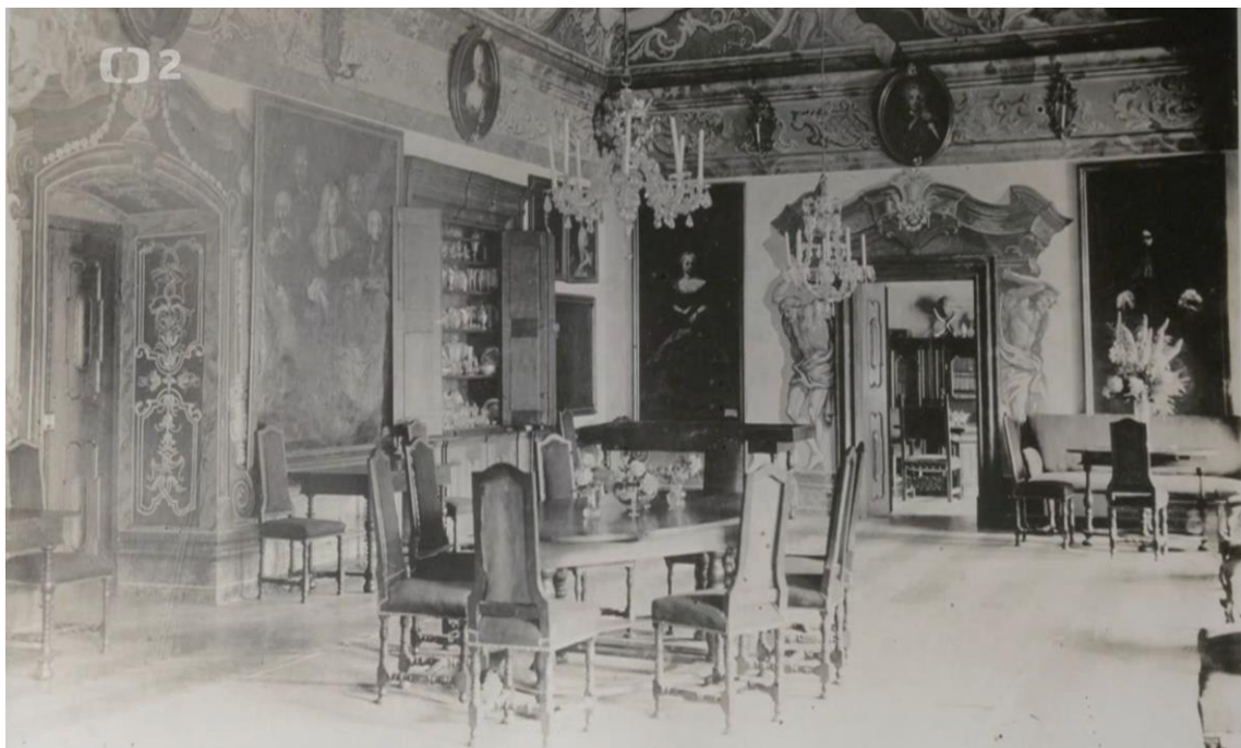
Obr. č. 4 – Zámek Manětín – interiér zámeckého pokoje před rokem 1945. ČESKÁ TELEVIZE. iVysílání. Skryté skvosty – Manětín . [on line].