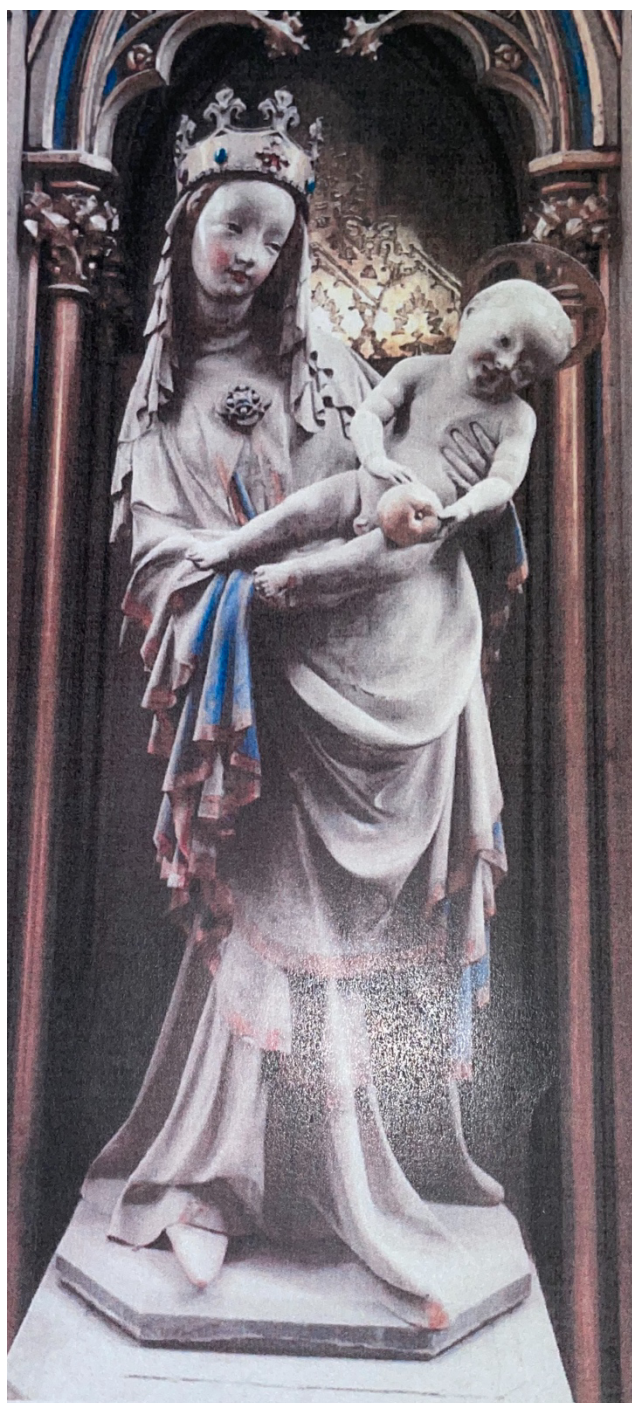
Příloha č. 9: Obrázek sochy Plzeňské madony. 125