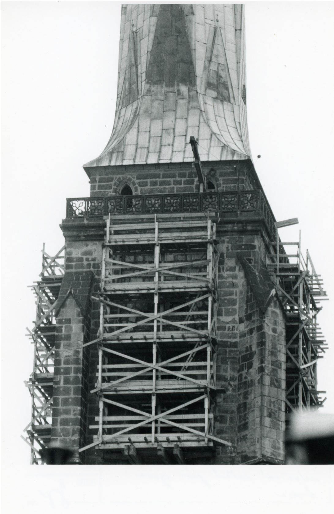
Příloha č. 8: Obrázek opravy věže v 80. letech 20. století. 124