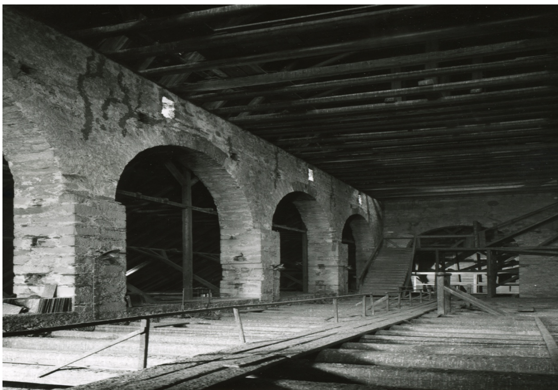
Příloha č. 5: Obrázek krovu katedrály sv. Bartoloměje po rekonstrukci. 121