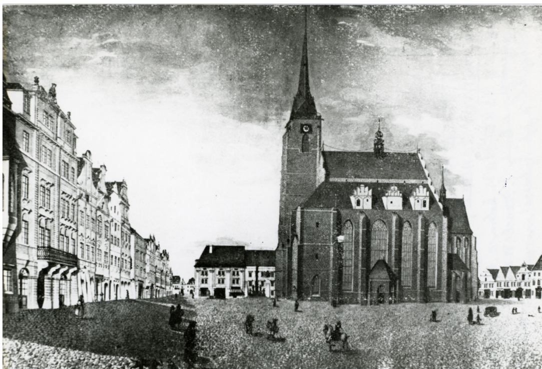
V. Schell, Plzeňské náměstí, kolem r. 1810