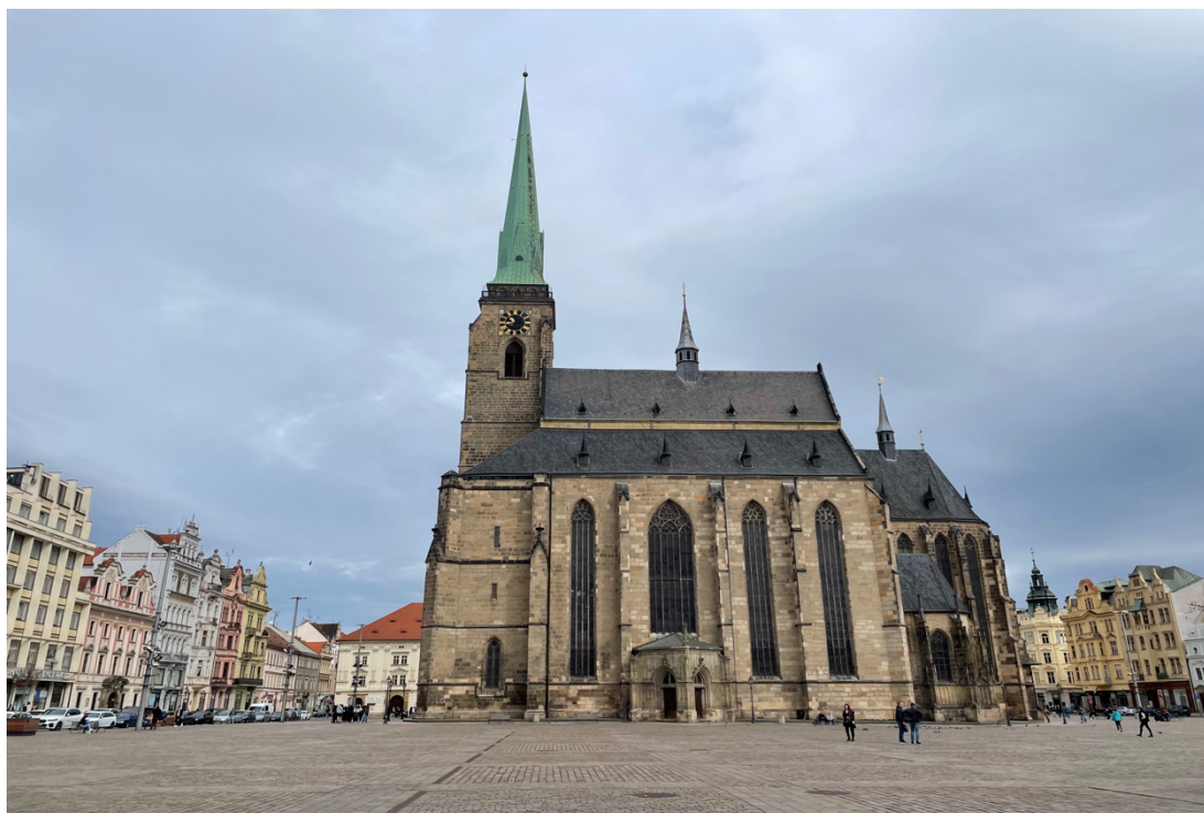
Příloha č. 7: Obrázek katedrály sv. Bartoloměje ve 21. století. 123