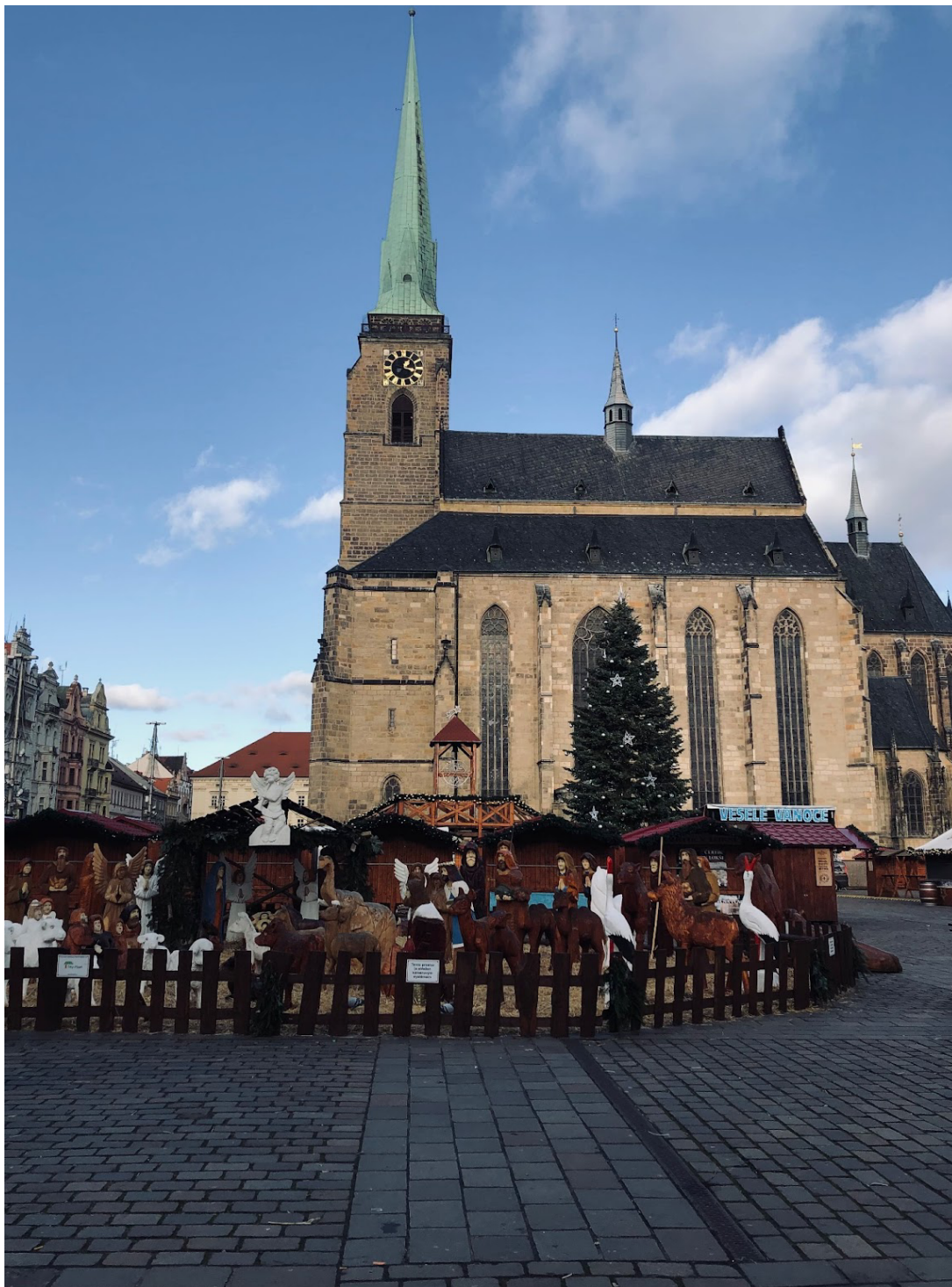
Příloha č. 3: Obrázek katedrály sv. Bartoloměje při vánočních trzích. 119