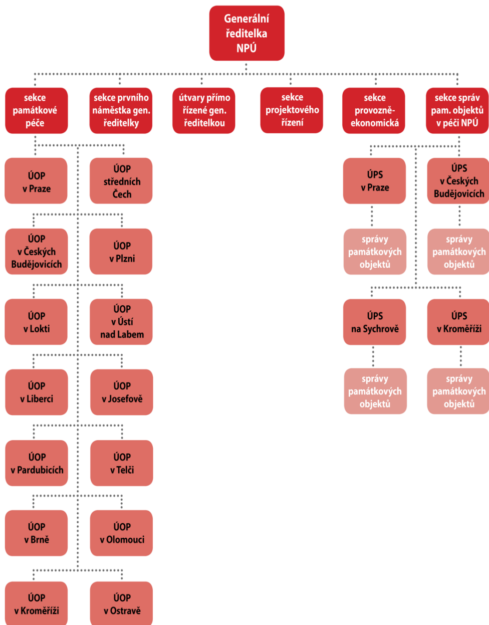
Příloha č. 15: Schéma organizace NPÚ. 131