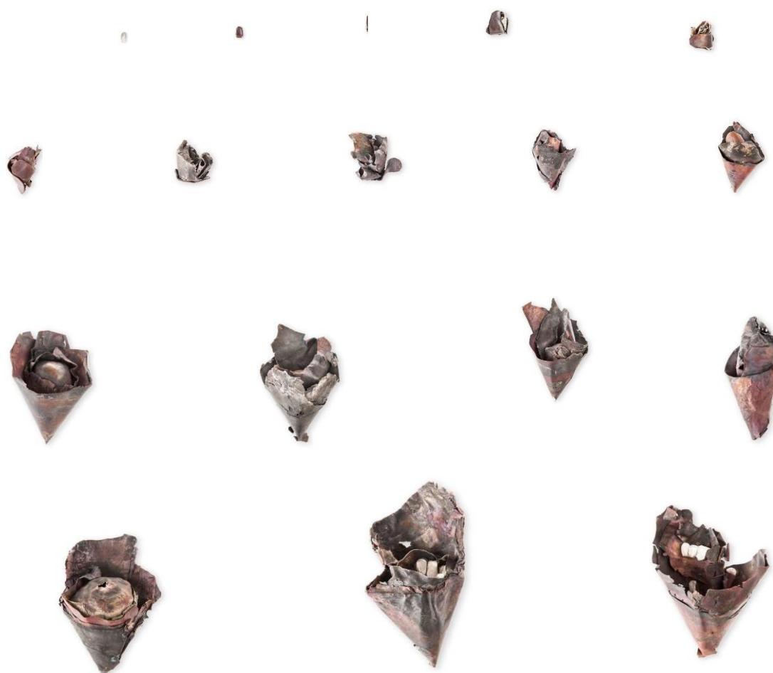
Obrázek č. 2: Série broží „for Baudelaire“ 8

Tato série reflektuje právě ten moment, kdy díky rozpadu vzniká nová hodnota. Série je stop motion ve šperku, kdy každá brož je stádiem vývoje nebo rozkladu.