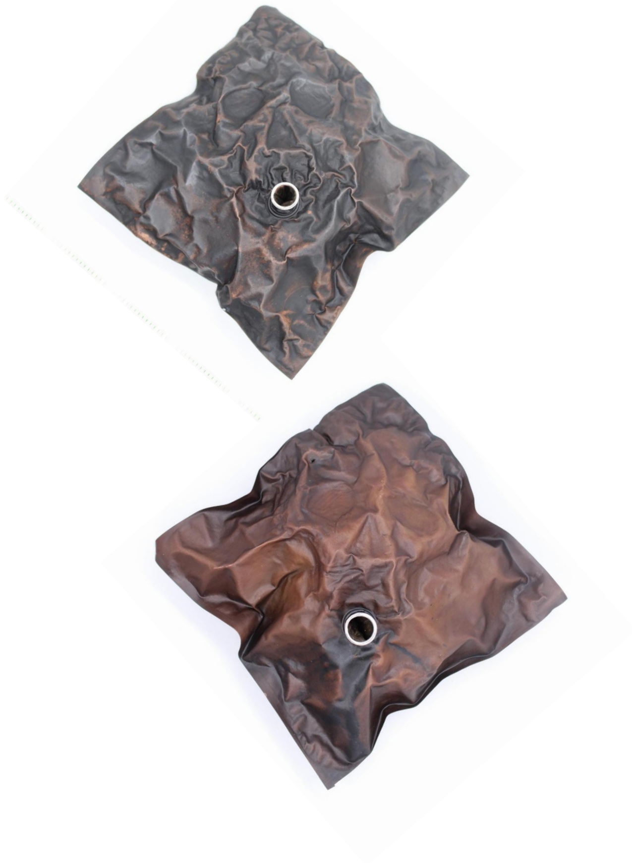
Obrázek č. 26: Brože „Inspirium“ 41