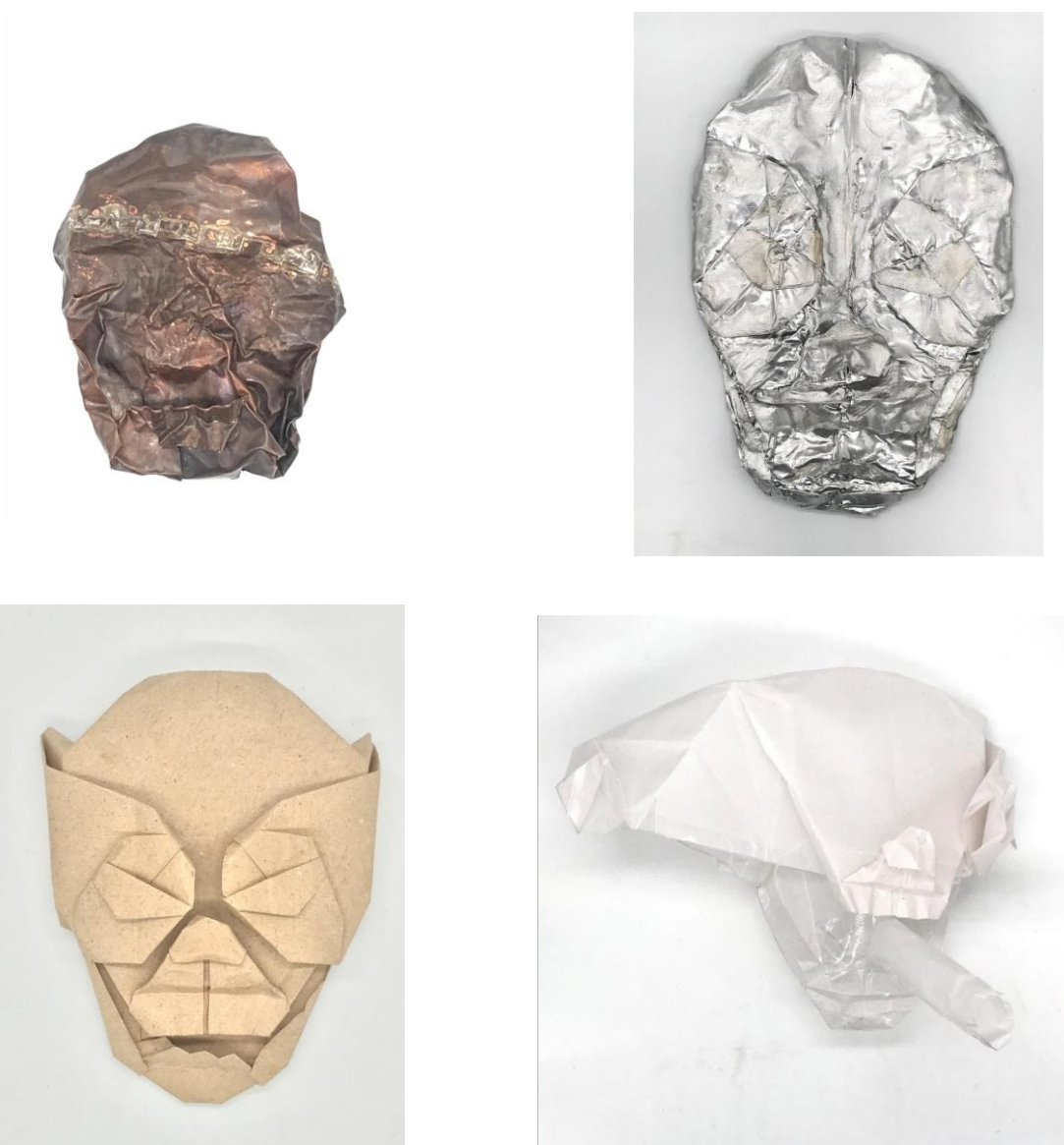
Obrázek č. 13,14,15,16: Experiment s kompozicí lebky 31

Další experimentace s tvarem se týkala znázornění smrti skrze její symbol, a to lebku. Rozhodl jsem se pro formování tvaru lebky tak, abych ji posléze mohl nafouknout a tím destruovat. Zkoušku jsem provedl v několika materiálech, v papíru, mědi, hliníku a pauzovacím papíru, který jsem formoval tak, abych již tuto zkoušku mohl nafouknout.