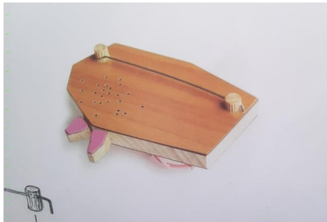
Obrázek č. 7: Ukázka brožového zapínání 16

Konstrukce brožového zapínání byla technologicky náročnější, než jsem si z počátku myslel. Jedním z hlavních problémů, se kterým jsem se potýkal, bylo, jak samotné zapínání upevnit na objekt, který je tvořen materiálem o síle 0,1mm tak, aby se zapínání při nošení nevytrhlo, nezabořilo do podkladu anebo, aby objekt nějak nedeformovalo. Tento problém jsem vyřešil vletováním konstrukce samotného zapínání do vnitřku objektu tak, aby byly viditelné pouze dva konce, které slouží pro upevnění jehly a pro pouzdro, do kterého je zaháknutý hrot tak, aby při nošení nebyl nebezpečný pro nositele, a aby nepoškodil oděv na kterém je brož upevněna.