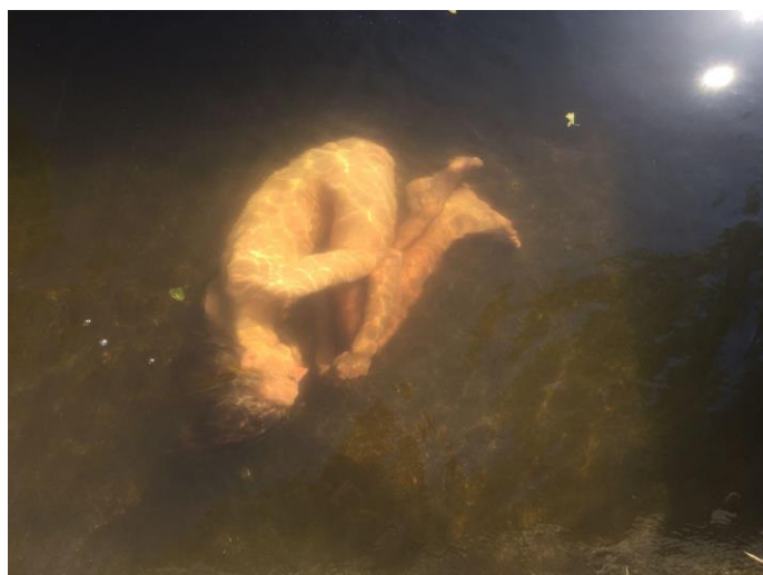
Obrázek č. 1: Experiment ve vodě 6

Většinou, když zpracovávám nějaké téma ve vizuální podobě, tak se s ním snažím co nejvíce konfrontovat. V tomto případě jeden z mých prvních experimentů bylo ponoření se do vody, vydechnutí a potopení se na dno. Došlo tak k úbytku kyslíku v těle a po chvíli setrvání na dně, jsem měl přirozeně potřebu, se nadechnout. Po vynoření jsem tak prožil, jak silný je první nádech. Tento experiment jsem provedl intuitivně, aniž bych věděl, že jsem se při porodu dusil.