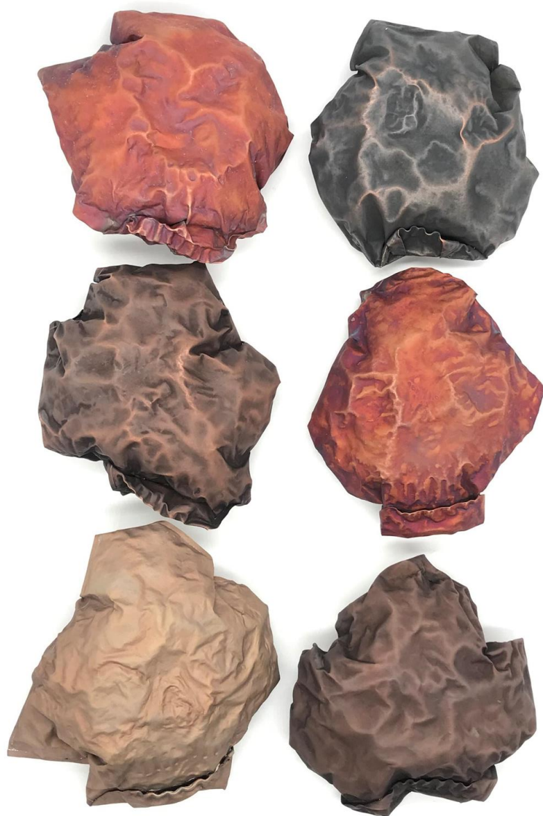
Obrázek č. 25: Brože „Inspirium“ 40