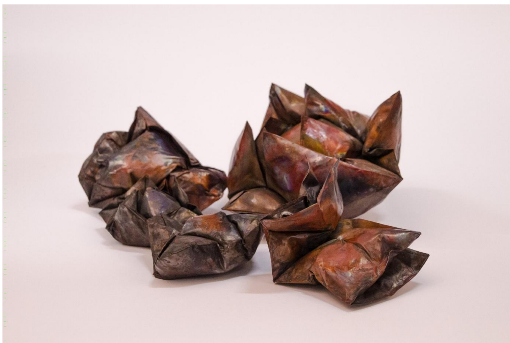
Obrázek č. 17: Experiment tvarování pomocí páry 32

S tímto experimentem jsem se oddálil od původní ideje, při které jsem chtěl používat vlastní dech k formování díla. Ve chvíli, kdy se složený objekt začal nafukovat, začal zároveň i růst a nabývat na objemu – tím pádem jsem „vdechnul“ život, aniž bych do něj musel vdechovat vzduch ústy.