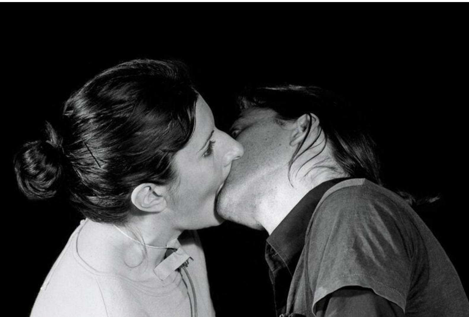
Obrázek č. 8: Performance „Breathing in, breathing out - Marina Abramovic a Ulay, 1977 23