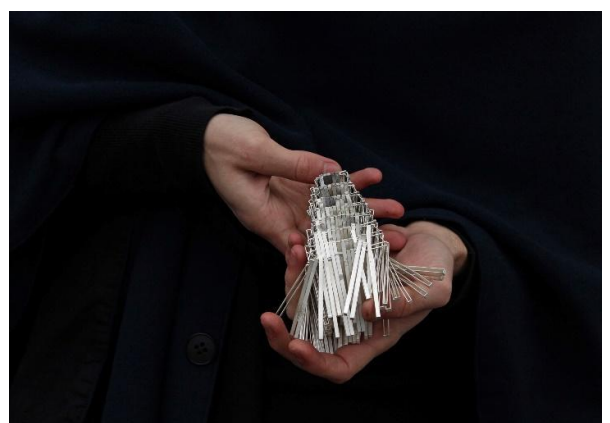
Obrázek č. 5: Stříbrný objekt „Alchymie“ 11