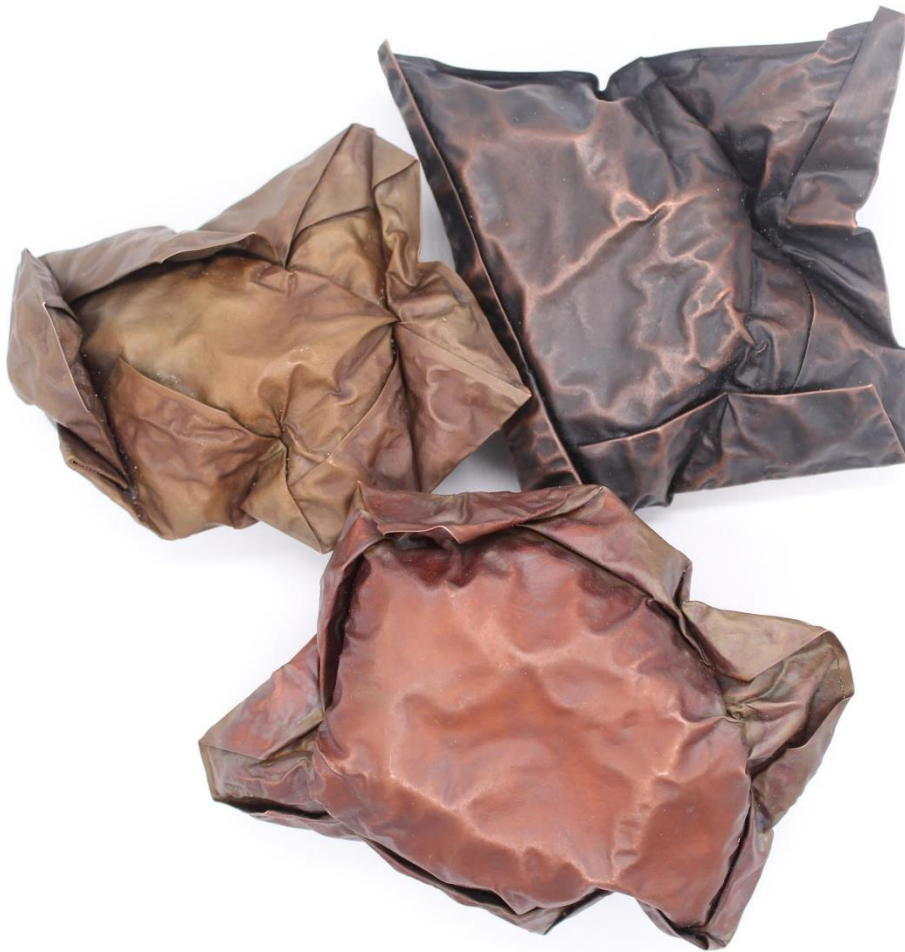
Obrázek č. 23: brože „Inspirium” 38