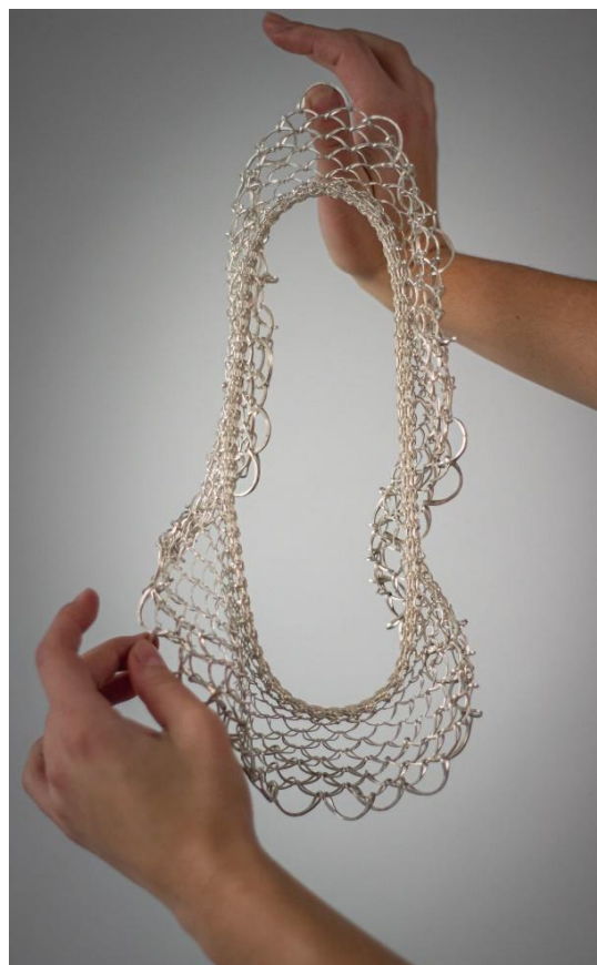
Obrázek č. 6: Náhrdelník "fraktál" 12