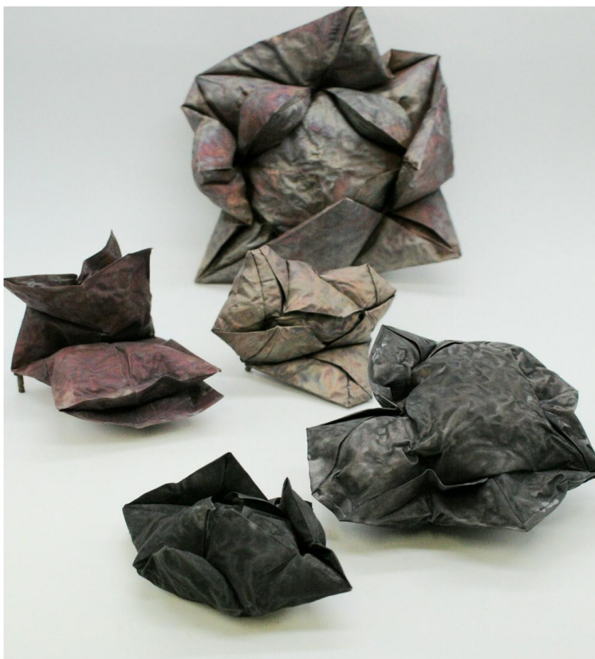
Obrázek č. 18: prototypy 33

Pro první sérii objektů jsem zvolil obyčejný čtvercový podklad, který při nafouknutí člověku asociuje polštář. Volba právě tohoto tvaru není náhodná. Při experimentu s tímto tvarem jsem si uvědomil, že polštář je právě něco, co v člověku nejen vzbudí pocit měkkosti a bezpečí, ale hlavně je to objekt, který doprovází člověka od kolébky až po rakev. Tím pádem byl tento tvar v souladu s mým konceptem.