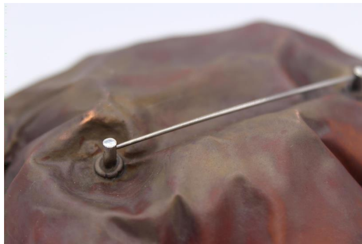
Obrázek č. 8: Realizované brožové zapínání 17