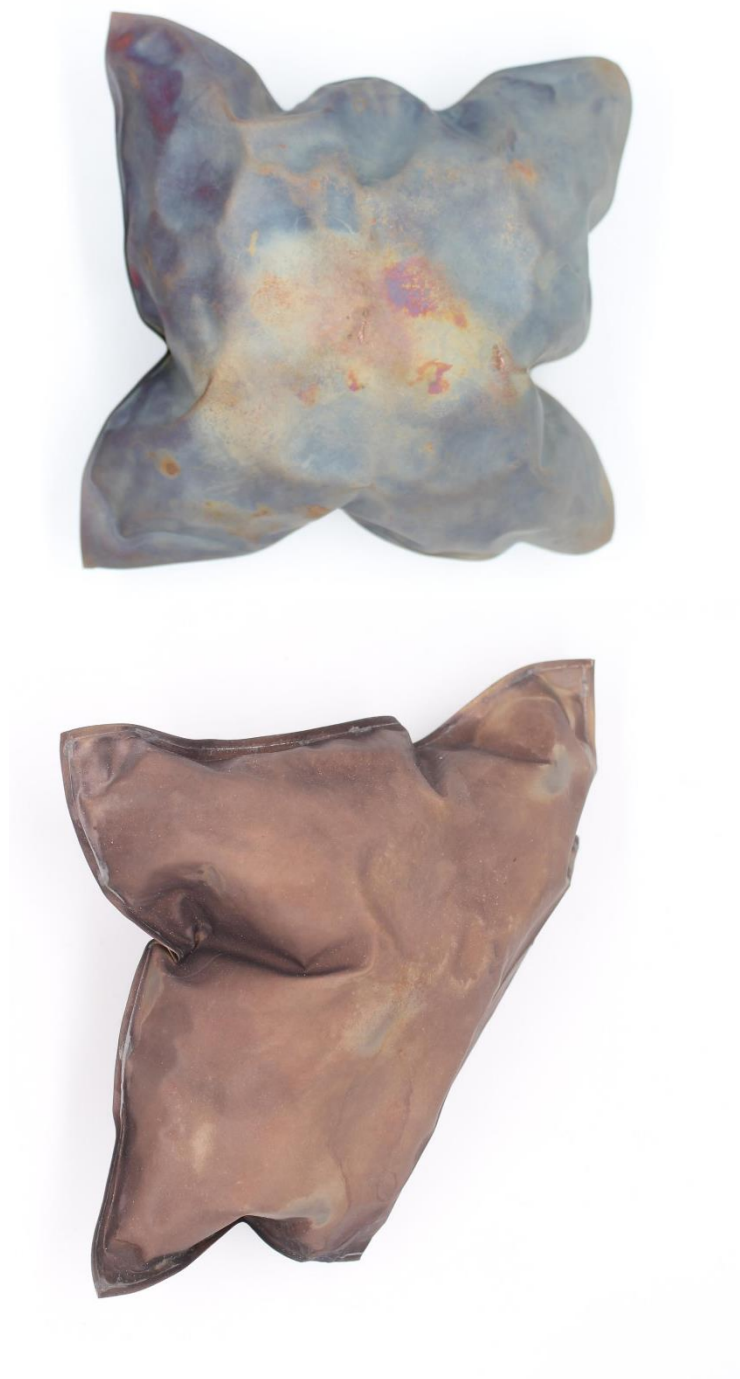
Obrázek č. 19: Objekty „Inspirium“ 34