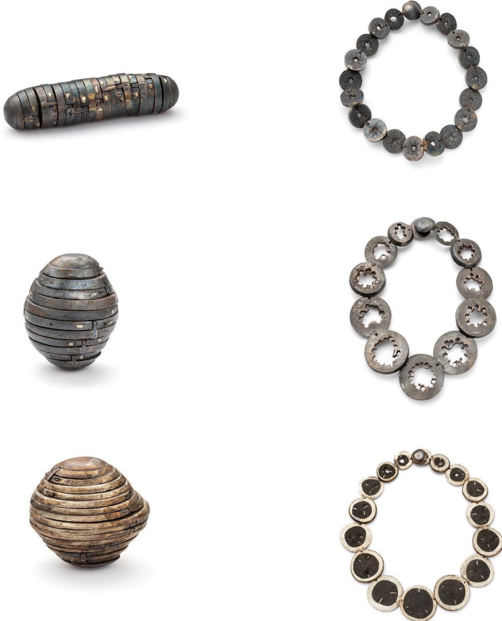
Obrázek č. 3: Náhrdelníky „Ego Centric“ 9

Série náhrdelníků, která nese název Ego centric naráží na princip, který je ve šperku často používán jako jakási univerzální formule, a to ten, že šperk jako objekt musí komunikovat s tělem. Já se rozhodl tuto poučku popřít tím, že jsem vytvořil sadu náhrdelníků, které nekomunikují s okolím jako šperk, ale spíš jako do sebe uzavřený objekt, který si svůj potenciál nechává pro sebe. Nositel si pak onen princip nositelnosti musí najít sám skrze svou investigaci a interakci s tímto objektem.