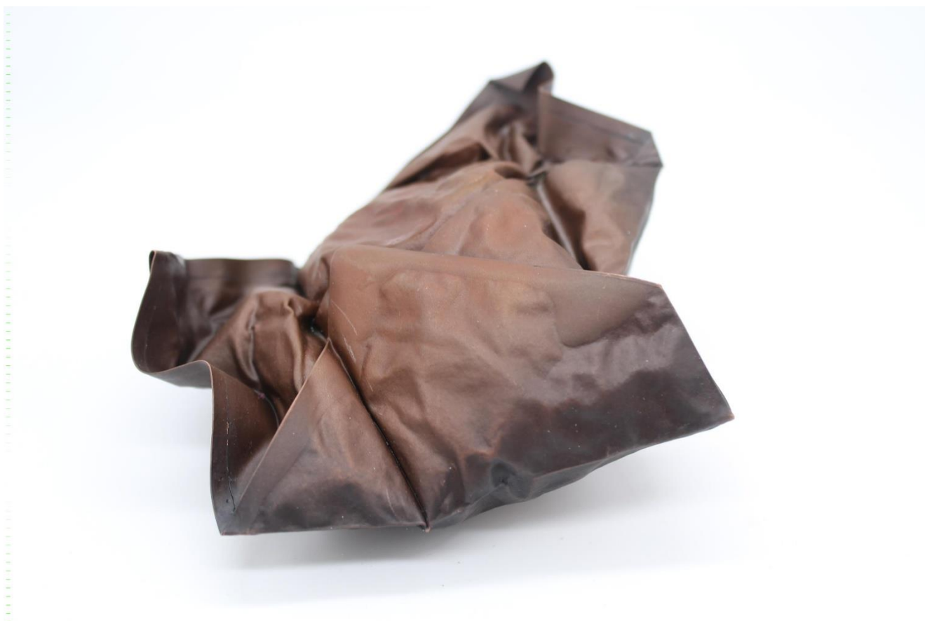
Obrázek č. 22: Brož „Inspirium“ 36