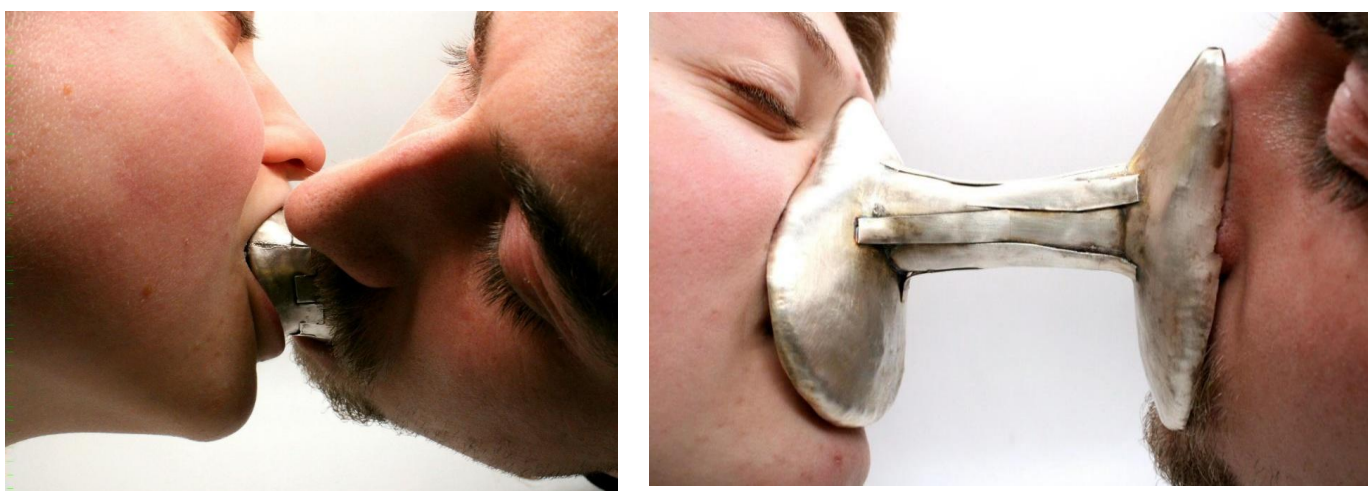
Obrázek č. 10 a 11: experiment se sdílením dechu 29

Jeden z prvních experimentů reflektoval sdílený dech, zároveň vytvořil bariéru mezi dvěma lidmi, kdy dochází k pocitu intimacy, ale zároveň k oddělení. Jediné, co spojuje obě osoby, je právě dech.