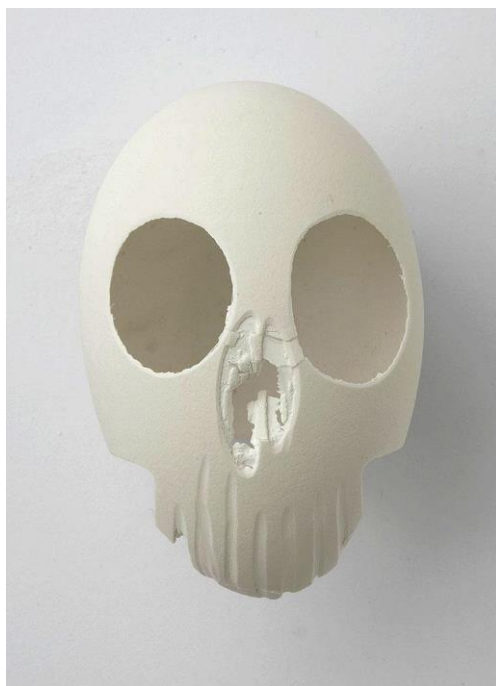
Obrázek č. 9: Objekt – lebka, 2013 husí vejce 25

V současném šperku je několik autorů, kteří se svojí tvorbou zaměřují na existenciální témata. V prvním případě bych rád zmínil Babbete Boucher, jejíž tvorba mnou rezonuje, a jejíž práce reflektuje právě téma jako je smrt. Dalším autorem, který se zaměřuje na