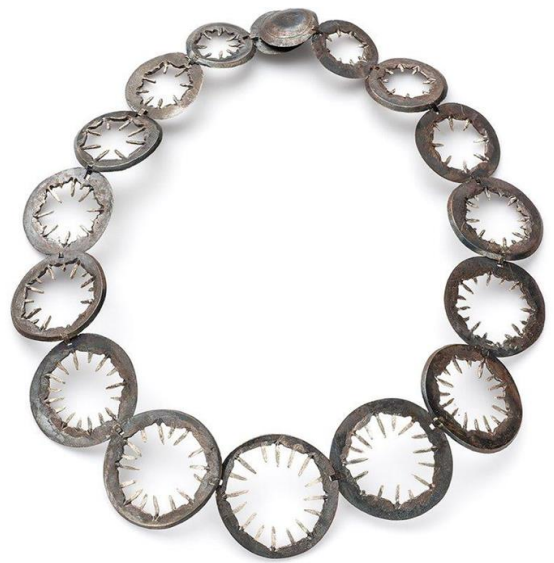
Obrázek č. 4: Náhrdelník „Ego Centric“ 10