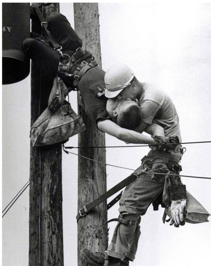
Obrázek č. 7: Rocco Morabito „The Kiss of Life“, 1967 20

Jeden z první obrázků, které jsem začlenil do mé rešerše, zachycoval dva pracovníky opravující vysoké vedení. Jeden dostal zásah proudem a ten druhý ho resuscitoval dýcháním z úst do úst. Tento výjev obsahoval onu esenci, kterou jsem pro tuto sérii na začátku hledal – oscilace mezi životem a smrtí skrze něco tak efemérního jako je dech.