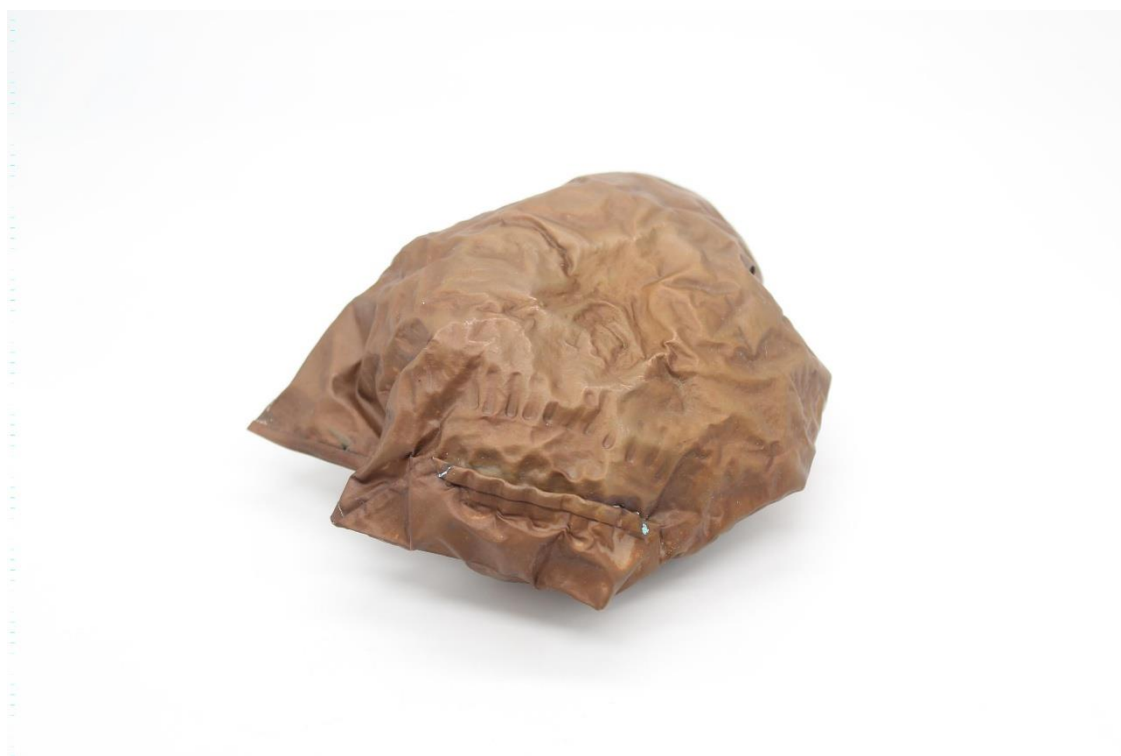
Obrázek č. 23 a 24: Brože „Inspirium“ 39