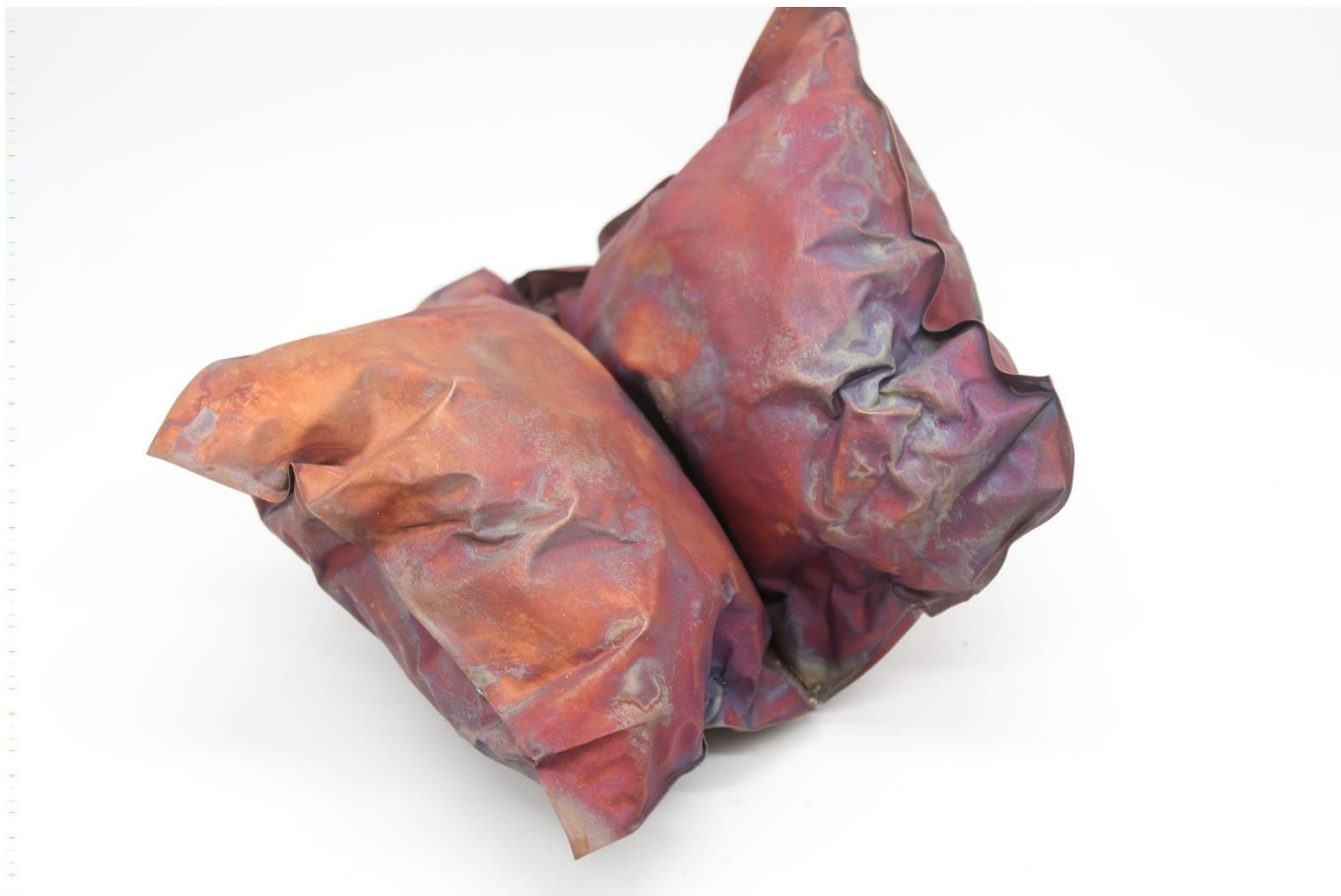
Obrázek č. 20: Objekt „Inspirium“ 35