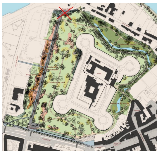
Obrázek č. 2: Vizualizace půdorysu revitalizace Tyršových sadů

tedy nízko zastřiženého, pravidelně udržovaného a monokulturního typu. Celý prostor je protkán stezkami (viz obrázek č. 2). Jedním z vizuálně dominantních prvků parku je podzámecká promenáda, jejíž plocha je z betonu a obsahuje výřezy s vysázenými keři, okrasnými záhony a stromy (viz obrázek č. 3). Podél cest jsou umístěny ocelové odpadkové koše a dřevěné lavičky různých šířek a různého typu. Promenáda je doplněna o zastřešené pergoly a na jejím jižním konci se nachází nově vybudovaná kavárna s názvem Galerie Café (viz obrázek č. 4). Podél promenády se nachází tzv. Relax park s herními prvky (viz obrázek č. 5) pro děti, jež tvoří převážně dřevěné atrakce a akátové sloupy, které mají poněkud paradoxně (vzhledem ke kauze ohledně masivního kácení) utvářet „atypickou reminiscenci lesního