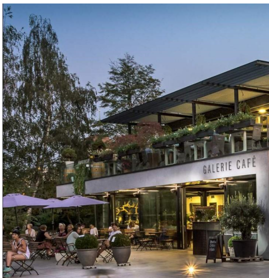
Obrázek č. 4: Galerie Café (Park Restaurant 2019)