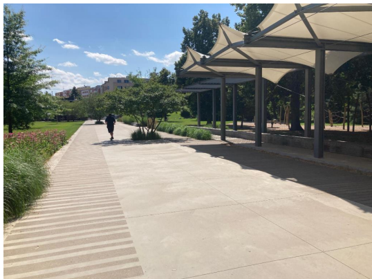
Obrázek č. 3: Promenáda s pergolou