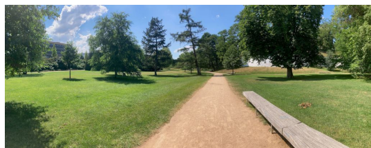
Obrázek č. 1: Prostor parku

s vysokou korunou (viz obrázek č. 1). Většina plochy parku je pokryta trávnikem anglického,