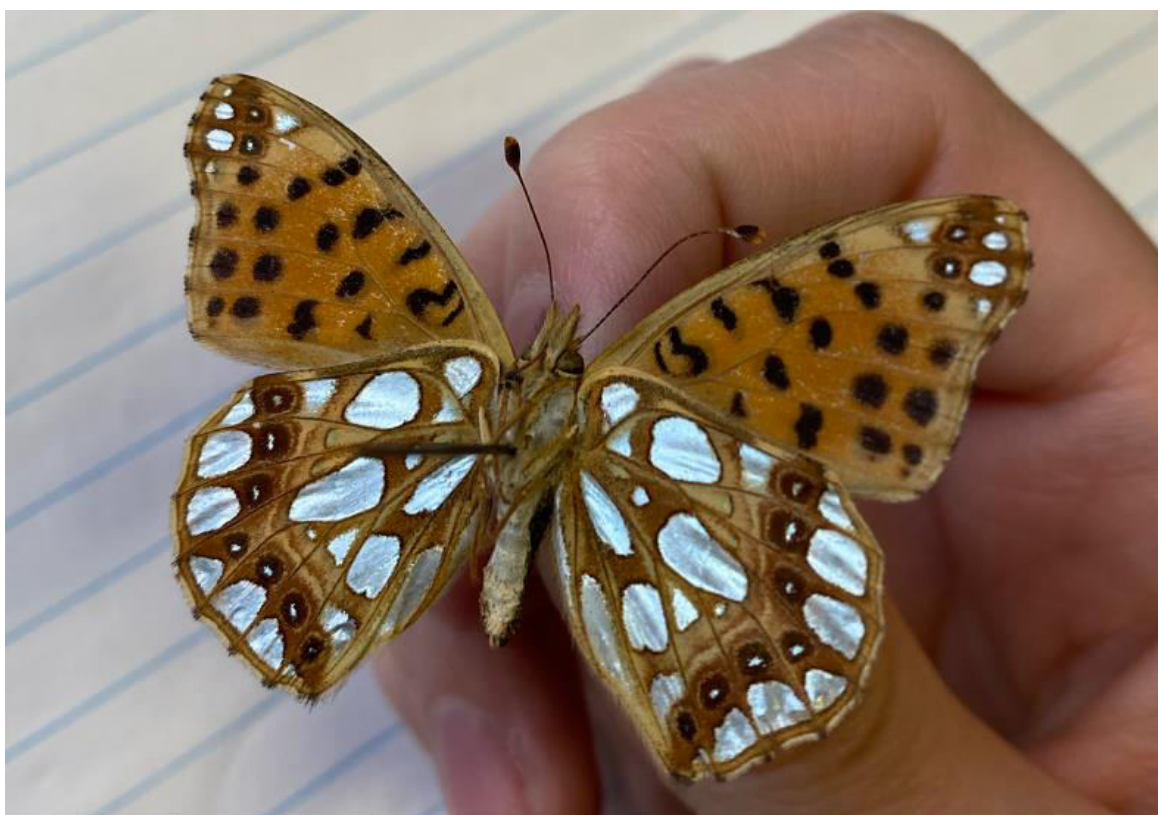
Obr. 4. Issoria lathonia z čeledi Nymphalidae ze sbírky Antonína Hájka z krabice č. 17.

Araschnia burejana Bremer, 1861 - Tokyo-Japan: 08.08.1954 (2)