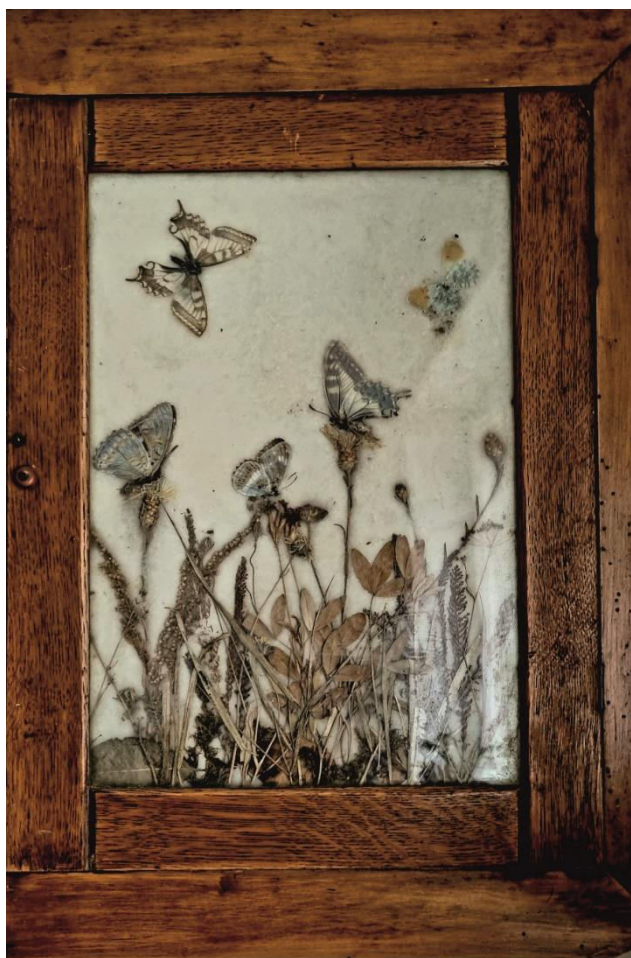
Obr. 1. Krabice s motýly zhotovená Antonínem Hájkem.

Sbírka Antonína Hájka (inventární číslo E 20088, přírůstkové číslo 1/81) byla přejata z Okresního muzea v Blovicích 21. 4. 1980. Celkem obsahuje 19 sbírkových krabic. Krabice jsou dřevěné s proskleným víkem. Byly vyráběny na míru a jsou umístěné v dřevěné skříni ve vodorovné poloze (Obr. 13.). Výplň krabic je tvořena dřevěným materiálem, případně tvrdým papírem. Pan Antonín Hájek pocházel z Chocenic č. p. 3. Nepodařilo se dohledat žádné životopisné údaje. Pouze se lze domnívat, že nezanechal žádné přímé potomky (ústní sdělení). Z pozůstalosti pana Hájka je známa také designová krabice, kterou věnovala manželka pana Hájka starostovi obce Chocenice (Obr. 1.).