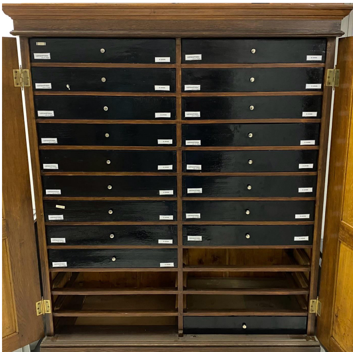
Obr. 13. Způsob uložení sbírkových krabic Antonína Hájka v depozitáři Západočeského muzea v Plzni.