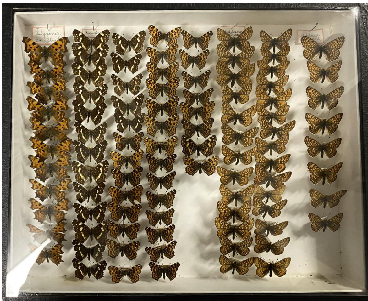
Obr. 8. Krabice č. 14 Jaroslava Poláka se zástupci z čeledi Nymphalidae.