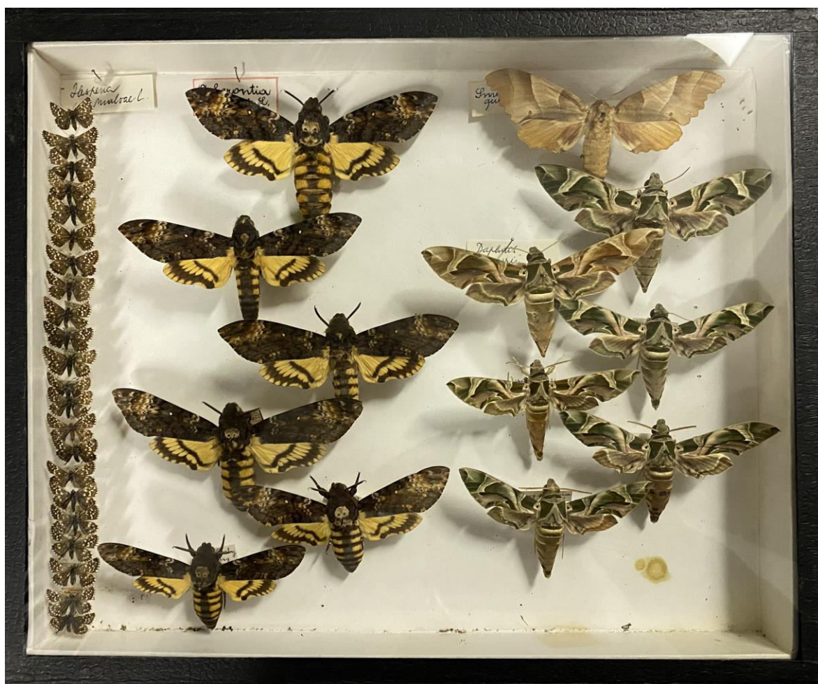
Obr. 10. Krabice č. 26 Jaroslava Poláka.

Hyles vespertilio (Esper, 1779) - Hard Ht. Rhin Wenck : 21.07.1940 (1)