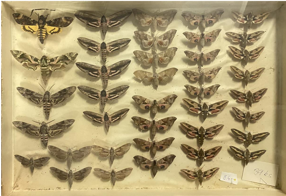
Obr. 5. Krabice č. 4 Antonína Hájka se zástupci z čeledi Sphingidae.

Deilephila porcellus (Linnaeus, 1758) - Košíře: 11.05.1928 (1 ex larvae), 29.05.1935 (1 ex larvae)