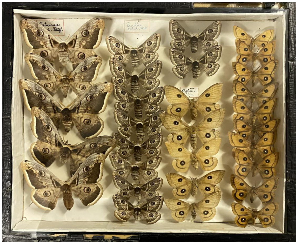
Obr. 9. Krabice č. 40 Jaroslava Poláka se zástupci z čeledi Saturniidae.

Saturnia pavonia (Linnaeus, 1758) - Dobřív: 08.04.1949 (1), 18.04.1949 (1). Hrádek: 10.04.1941 (1), 12.04.1941 (1), 12.04.1942 (1). Liptovský Mikuláš: 01.04.1949 (2 leg. Veselý). Mirošov: 10.04.1951 (2). Rokycany: 08.04.1955 (1). Slovenské Nové Mesto: 22.03.1960 (1 ex larvae), 24.03.1960 (3 ex larvae), 25.03.1960 (2 ex larvae), 27.03.1960 (1 ex larvae), 29.03.1960 (1 ex larvae). Slovensko: 15.04.1949 (1), 16.04.1949 (1). Šumava: bez d. n. (1 leg. Lehečka)