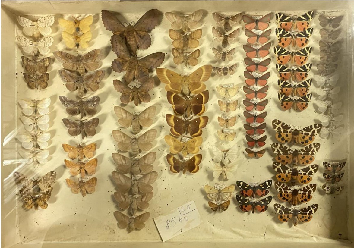
Obr. 6. Krabice č. 5 Antonína Hájka.