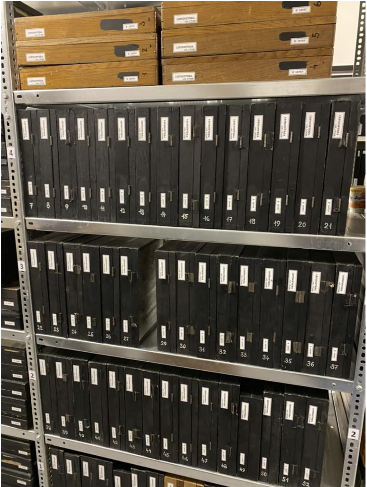
Obr. 14. Způsob uložení sbírkových krabic Jaroslava Poláka v depozitáři Západočeského muzea v Plzni.