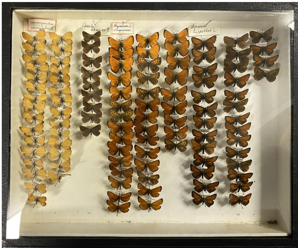
Obr. 7. Krabice č. 22 Jaroslava Poláka.

26.06.1948 (1), 29.06.1949 (1), 24.06.1951 (1), 25.06.1951 (1), 28.06.1951 (1), 10.06.1953 (1), 22.06.1953 (1), 24.06.1953 (1), 26.06.1954 (1), 08.07.1954 (2), 14.06.1956 (1), 10.07.1957 (1), 30.07.1957 (1), 10.06.1958 (1), 20.06.1958 (3), 14.08.1958 (1), 05.07.1959 (2), 08.07.1959 (1), 10.07.1959 (2), 12.07.1959 (1), 14.07.1959 (1), 15.07.1959 (1), 30.07.1959 (1)