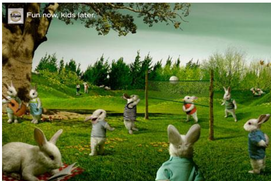
Obrázek č. 2: Příklad sociálního marketingu kampaně Fun now, kids later. 60