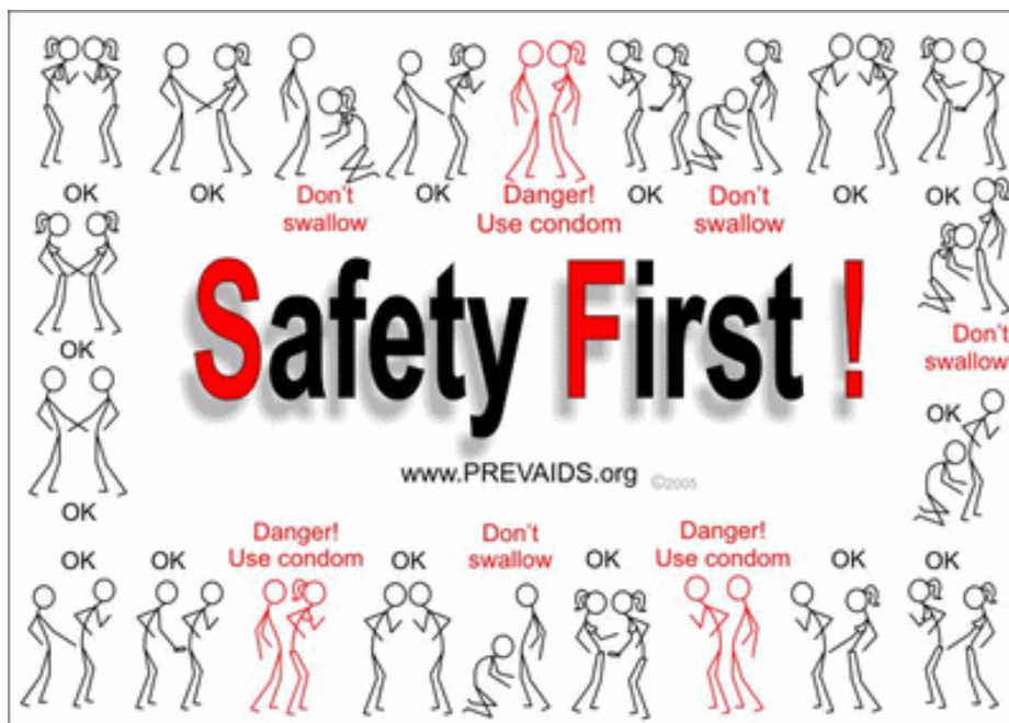
Obrázek č. 1: Příklad sociálního marketingu